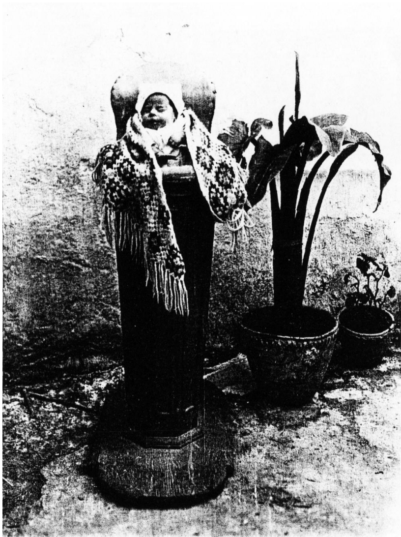
Fig. 2. Punctul 867 Manduria (TA) în Puglia