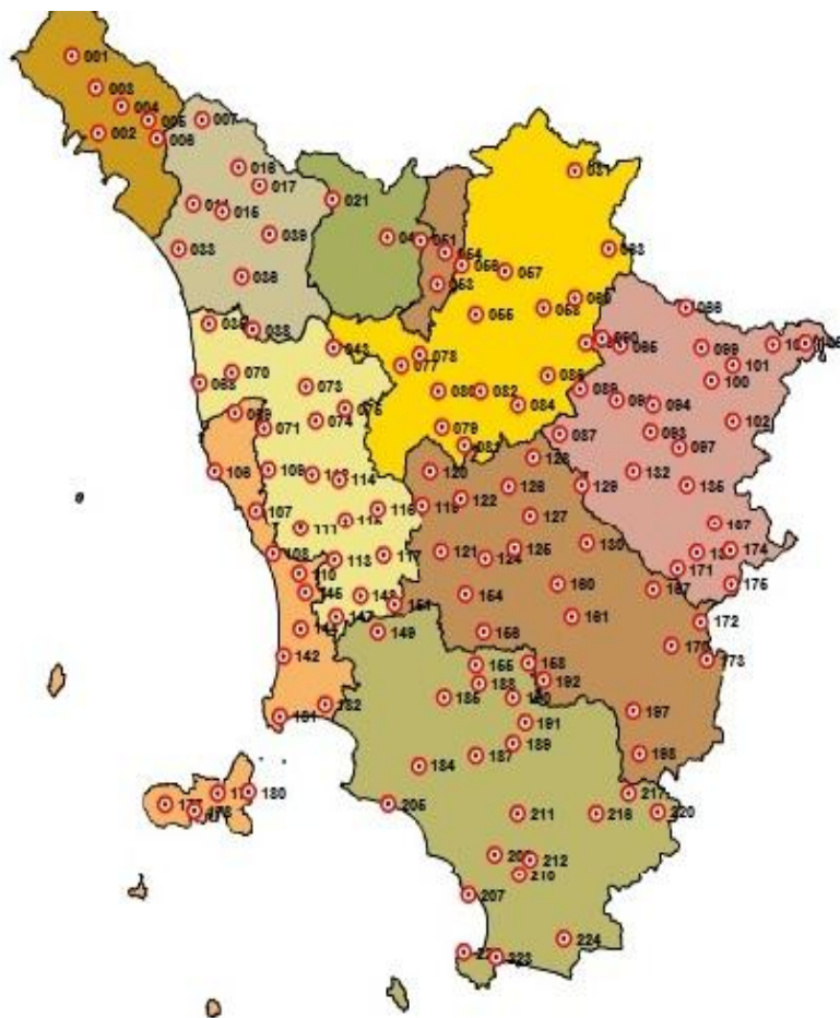
Fig. 3. 'mirtillo' (ALT-WEB)