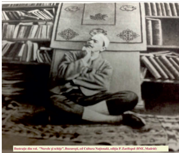
Ilustrație din vol. "Nuvele și schițe", București, ed. Cultura Națională, ediția P. Zarifopol (BNE, Madrid)