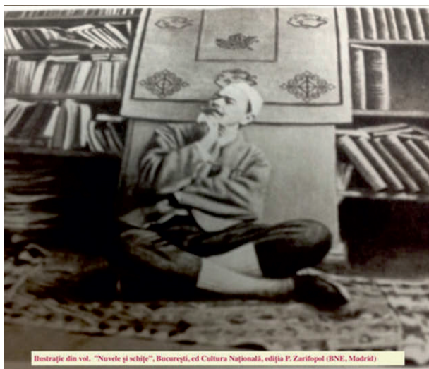
Ilustrație din vol. "Nuvele și schițe", București, ed. Cultura Națională, ediția P. Zarifop (BNE, Madrid)