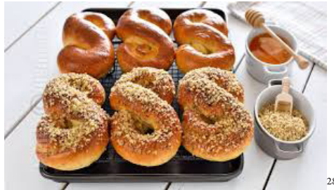
Mucenici (Rumänien und Rep. Moldau)

tes%2Fdefault%2Ffiles%2Fstyles%2Farticle-image-big%2Fpublic%2Fbrioche_krampus6.jpg&imgrefurl=https%3A%2F%2Fwww.haubis.com%2Fit%2Fnode%2F961&docid=cAzyZftz1xivAM&tbnid=cLQNI7iup5FyM%3A&vet=10ahUKEwiW1KrVls3XAhVlApoKHUf2ANc4ZBAzCD4oOza7..i&w=651&h=407&itg=1&bih=805&biw=1440&q=Krampuskuchen&ved=0ahUKEwiW1KrVls3XAhVlApoKHUf2ANc4ZBAzCD4oOza7&iact=mrc&uact=8