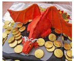
Liebe Sünde, Schokoladenkuchen