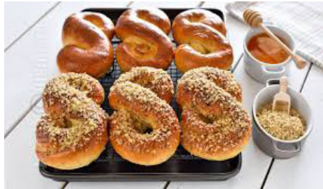
Mucenici (Rumänien und Rep. Moldau)

tes%2Fdefault%2Ffiles%2Fstyles%2Farticle-image-big%2Fpublic%2Fbrioche_krampus6.jpg&imgrefurl=https%3A%2F%2Fwww.haubis.com%2Fit%2Fnode%2F961&docid=cAzyZftz1xivAM&tbnid=cILQNI7iup5FyM%3A&vet=10ahUKEwiW1KrVls3XAhVlApoKHUf2ANc4ZBAzCD4oOza7..i&w=651&h=407&itg=1&bih=805&biw=1440&q=Krampuskuchen&ved=0ahUKEwiW1KrVls3XAhVlApoKHUf2ANc4ZBAzCD4oOza7&iact=mr&uact=8