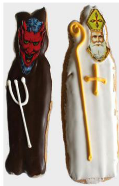
Lebkuchen Krampus und Nikolaus 20