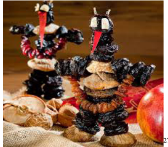
Pflamentoffel ( Teufel ) (Deutschland, Österreich)

„Im Sakralen liegt daher zunächst keine Garantie für Dauer, für Verehrung, für Tradition, und wenn es zur Tradition wird, ist dies schon der erste Schritt zur Auflösung seiner Sakralität .“ 26 – schreibt Luhmann.