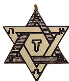
Salomos Siegel 22