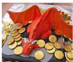
Liebe Sünde, Schokoladenkuchen