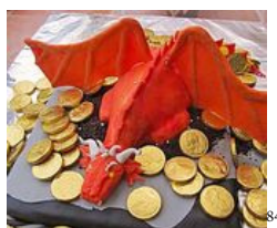
Liebe Sünde, Schokoladenkuchen