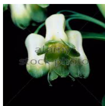
Salomos Siegel 21