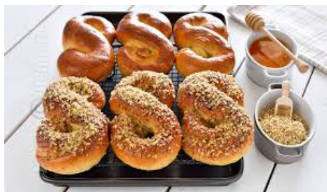
Mucenici (Rumänien und Rep. Moldau)

tes%2Fdefault%2Ffiles%2Fstyles%2Farticle-image-big%2Fpublic%2Fbrioche_krampus6.jpg&imgrefurl=https%3A%2F%2Fwww.haubis.com%2Fit%2Fnode%2F961&docid=cAzyZftz1xivAM&tbnid=cILQNl7iup5FyM%3A&vet=10ahUKEwiW1KrVls3XAhVlApoKHUf2ANc4ZBAzCD4oOzA7..i&w=651&h=407&itg=1&bih=805&biw=1440&q=Krampuskuchen&ved=0ahUKEwiW1KrVls3XAhVlApoKHUf2ANc4ZBAzCD4oOzA7&iact=mrc&uact=8