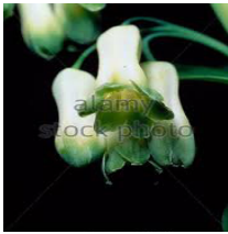
Salomos Siegel 21