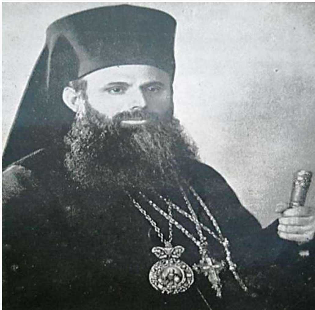
Înalt Prea Sfințitul D.D. Justinian Arhiepiscopul Bucureștilor, Mitropolitul Ungro-Valahiei și Preafericitul Patriarh al Bisericii Ortodoxe Române