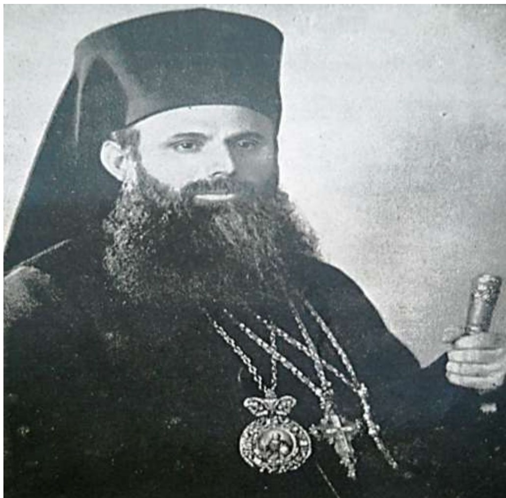
Înalt Prea Sfințitul D.D. Justinian Arhiepiscopul Bucureștilor, Mitropolitul Ungro-Valahiei și Preafericitul Patriarh al Bisericii Ortodoxe Române