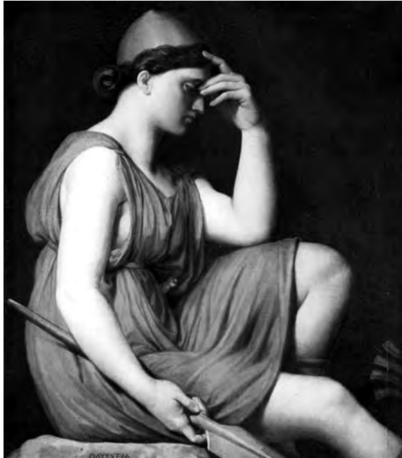
INGRES: Odiseu (studiu pentru Triumful lui Homer

secită, că s-au dogorît toate”; „Să știe de cînd au fost viforul cel mare la Sfinții 40 de Mucenici cînd au murit oameni mulți și vite nesocotite și pentru ca să să țină min-te am făcut însemnare, veleat 1797 mar-