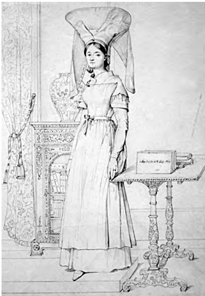
INGRES Femeie în costum specific regiunii Caen