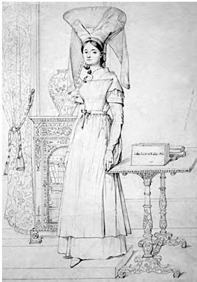
INGRES Femeie în costum specific regiunii Caen