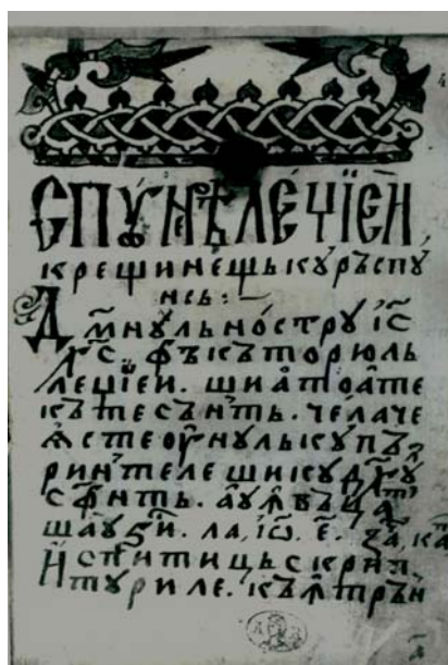
Fig. 2. Filă din ms. rom. 4818 (BAR), copiat de Popa Mihai, supranumit „Românul”.