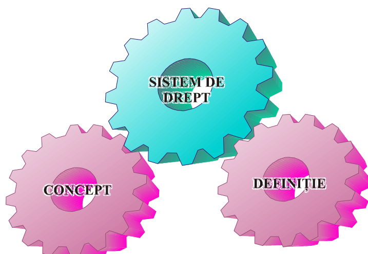
Schéma 1. L' indépendance du concept de la définition dans la terminologie juridique communautaire.

La définition du terme juridique doit être systémique, c'est-à-dire elle doit refléter le type de système ou de microsystème où s'encadre la notion définie mais le degré de technicité et la formulation des définitions doivent être adaptés aux besoins des utilisateurs.