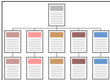
La struttura gerarchica

La struttura da utilizzare per una gran mole di testi è la gerarchica.