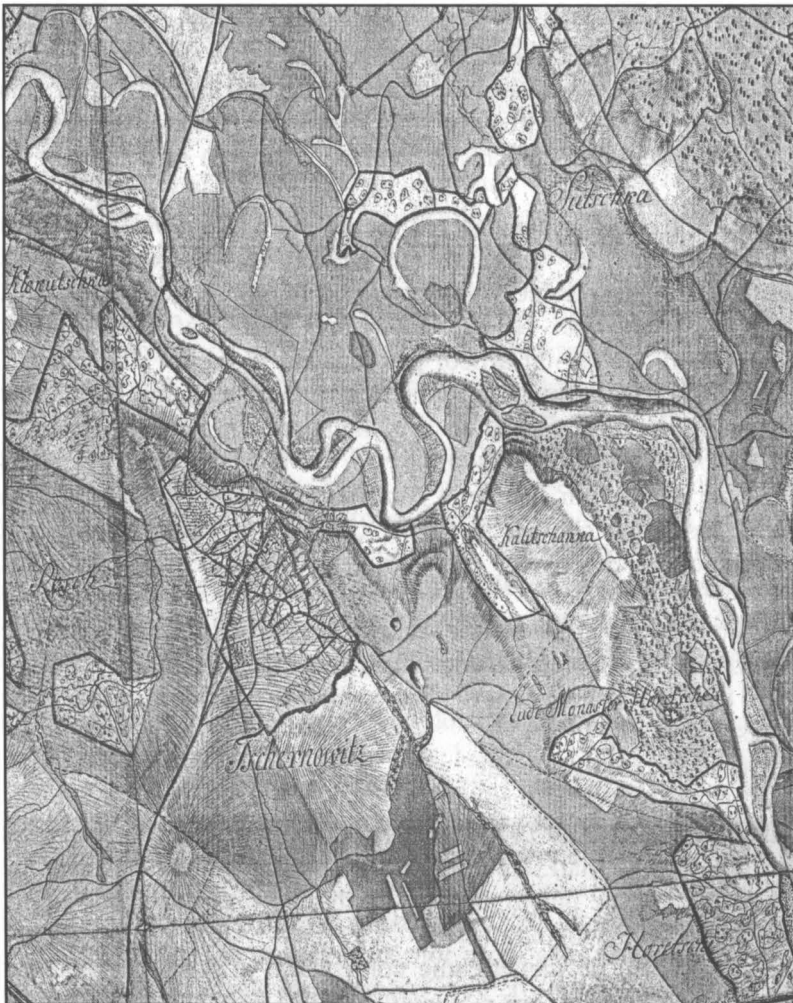
Fig. 4. Harta topografică a Cercului Bucovina [...] (H. von Otzellowitz, 1790) – reproducere demonstrativă a unui fragment din secțiunea care cuprinde orașul Cernăuți și împrejurimile (după copia xerox alb-negru aflată la Muzeul Național al Bucovinei, Suceava);

În sfârșit, putem subscrie întrutotul la opinia lui Dionisie Olinescu conform căreia, prin detalierea, minuțiozitatea cu care au fost lucrate și caracterul color, hărțile Budinsky reprezintă icoane fidele ale comunelor, de un neprețuit interes istoric și geografic, căci pe baza lor se poate deduce starea socio-economică a comunităților din Bucovina în a doua jumătate a secolului al XVIII-lea. De aici rezultă că eforturile de a le accesa și analiza ar fi pe deplin justificate.