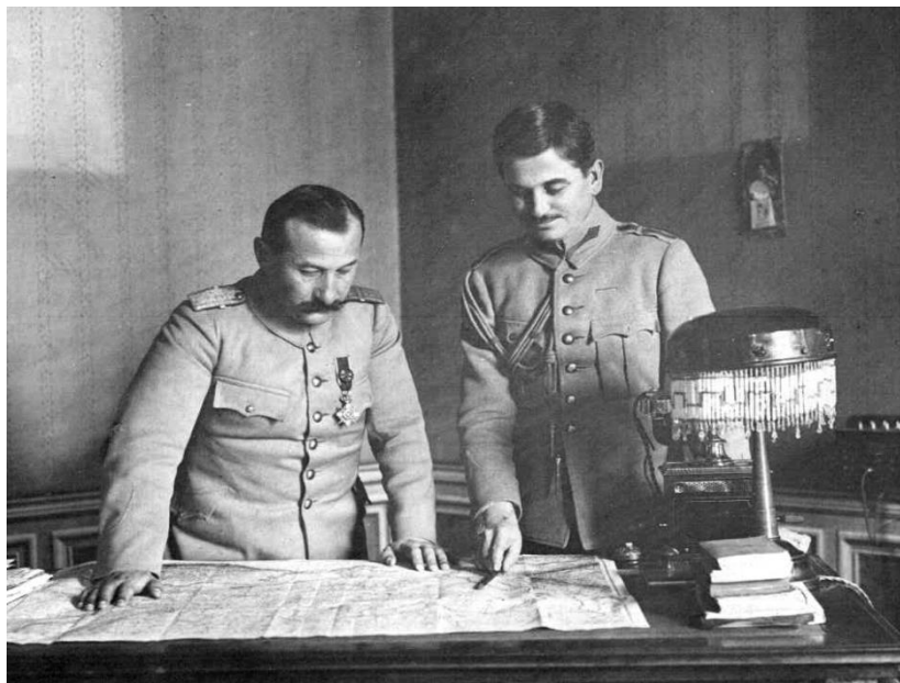
Generalul Iacob Zadik și locotenent-colonelul Rovinaru, pregătind intrarea trupelor române în Bucovina, 8 noiembrie 1918, Primăria din Suceava.