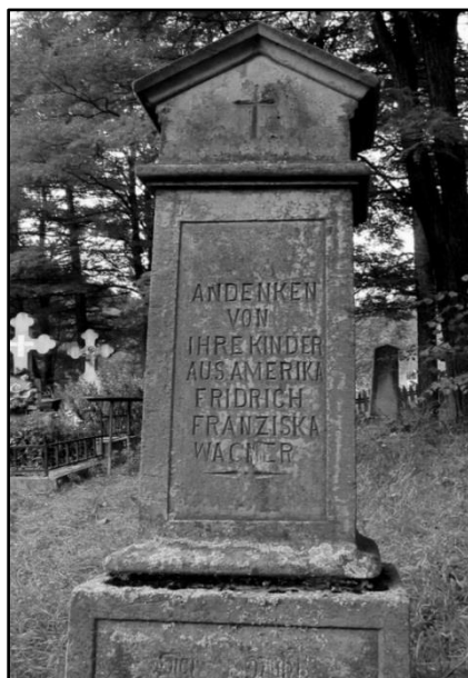
Foto 2. Gedenk-Grabstein. Eisenauer Friedhof

Der Niedergang des Bergbauwesens in diesem südlichen Buchenländer Bergland, der später große Kinderreichtum in dieser Gegend und die allgemeine Wirtschaftslage führten um 1900 auch hier zu Abwanderungen, vor allem über die Berge Richtung Siebenbürgen (vor allem in den Bistritz-Nassoder Raum) mit seinen evangelischen Sachsen, Raum, aus dem seinerzeit Siedler in die evangelischen Zipser-Siedlungen gekommen waren, aber auch nach Nordamerika 19 .