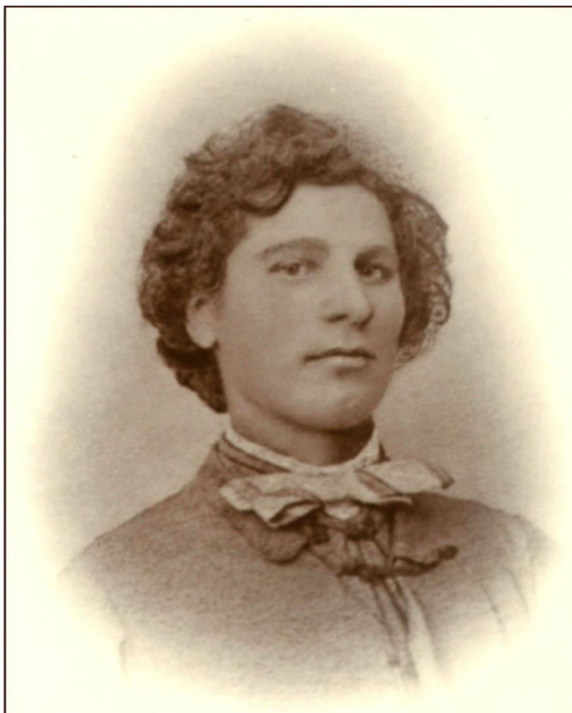
Simion Florea Marian în anul 1868