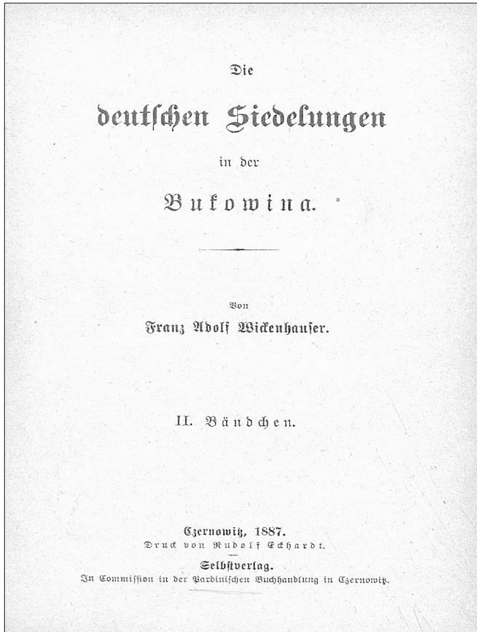
Pagina de gardă a volumului Coloniile germane din Bucovina , II, Cernăuți, 1887.