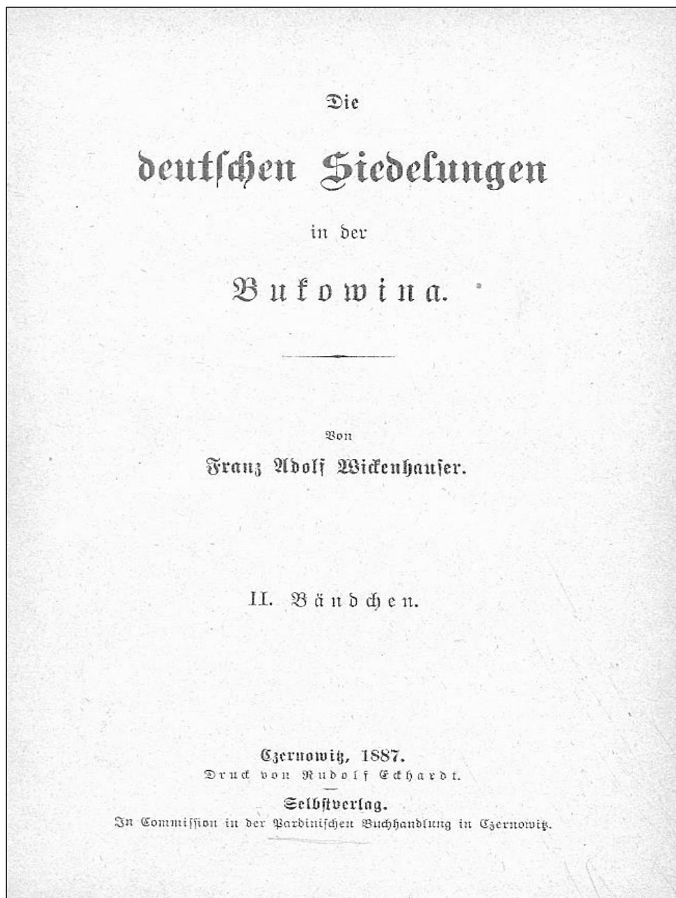
Pagina de gardă a volumului Coloniile germane din Bucovina , II, Cernăuți, 1887.