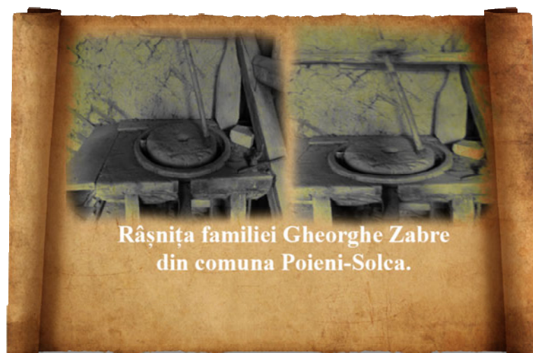
Fig. 1. Râșniță din comuna Poieni-Solca.