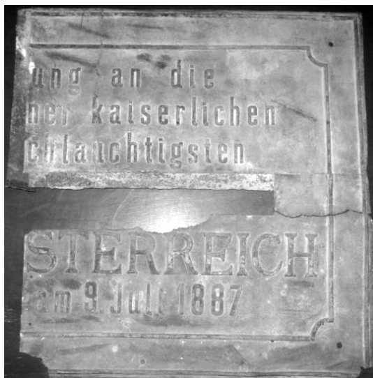
Foto 1. Inscripția comemorativă de pe placa frontală.

Soclul (Foto. 3), cu înălțimea de 2,10 m, este format din patru postamente pătrate, de dimensiuni diferite, suprapuse piramidal. Pe laturile celei de a treia componente a soclului (1,50 × 0,90 m) este săpată câte o nișă cu dimensiunile de 1,10 × 0,60 × 0,05 m. În nișa de pe fața sudică, cea dinspre șosea, a fost amplasată o placă făcută din plumb, cu dimensiunile de 1,10 × 0,60 m, pe care a fost înscris, cu litere în relief, aurite, un text menit să amintească de vizita prințului moștenitor Rudolf al Austriei (Foto. 1).