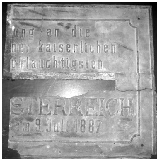
Foto 1. Inscripția comemorativă de pe placa frontală.

Soclul (Foto. 3), cu înălțimea de 2,10 m, este format din patru postamente pătrate, de dimensiuni diferite, suprapuse piramidal. Pe laturile celei de a treia componente a soclului (1,50 × 0,90 m) este săpată câte o nișă cu dimensiunile de 1,10 × 0,60 × 0,05 m. În nișa de pe fața sudică, cea dinspre șosea, a fost amplasată o placă făcută din plumb, cu dimensiunile de 1,10 × 0,60 m, pe care a fost înscris, cu litere în relief, aurite, un text menit să amintească de vizita prințului moștenitor Rudolf al Austriei (Foto. 1).