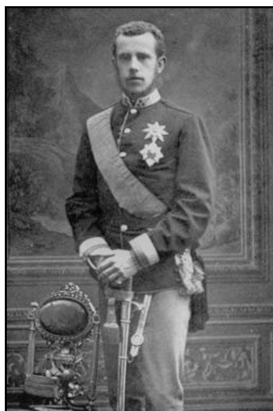
Prințul Rudolf al Austriei (1858–1889).

Ziarul cernăuțean „Bukowinaer Rundschau” a prezentat, în nr. 387/10 iulie 1887, p. 1–3, nr. 388/12 iulie 1887, p. 1–2 (Cernăuți) și nr. 389/14 iulie 1887, p. 2–4 (Rădăuți, Gura Humorului și Câmpulung) ample relatări ale vizitei prințului moștenitor Rudolf în Bucovina – orele exacte de sosire și plecare, componența comitetelor de primire din fiecare localitate prin care a trecut, felul în care a fost primit de locuitori, obiectivele ce au fost vizitate, festivitățile organizate, audiențele acordate etc. Pe tot traseul călătoriei sale, prințul Rudolf a fost întâmpinat cu parade, defilări de trupe, a trecut pe sub porți triumfale decorate cu steaguri naționale și austriece, a fost salutat de mulțimi entuziaste de supuși.