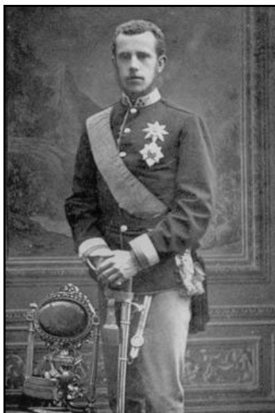
Prințul Rudolf al Austriei (1858–1889).

Ziarul cernăuțean „Bukowinaer Rundschau” a prezentat, în nr. 387/10 iulie 1887, p. 1–3, nr. 388/12 iulie 1887, p. 1–2 (Cernăuți) și nr. 389/14 iulie 1887, p. 2–4 (Rădăuți, Gura Humorului și Câmpulung) ample relatări ale vizitei prințului moștenitor Rudolf în Bucovina – orele exacte de sosire și plecare, componența comitetelor de primire din fiecare localitate prin care a trecut, felul în care a fost primit de locuitori, obiectivele ce au fost vizitate, festivitățile organizate, audiențele acordate etc. Pe tot traseul călătoriei sale, prințul Rudolf a fost întâmpinat cu parade, defilări de trupe, a trecut pe sub porți triumfale decorate cu steaguri naționale și austriece, a fost salutat de mulțimi entuziaste de supuși.