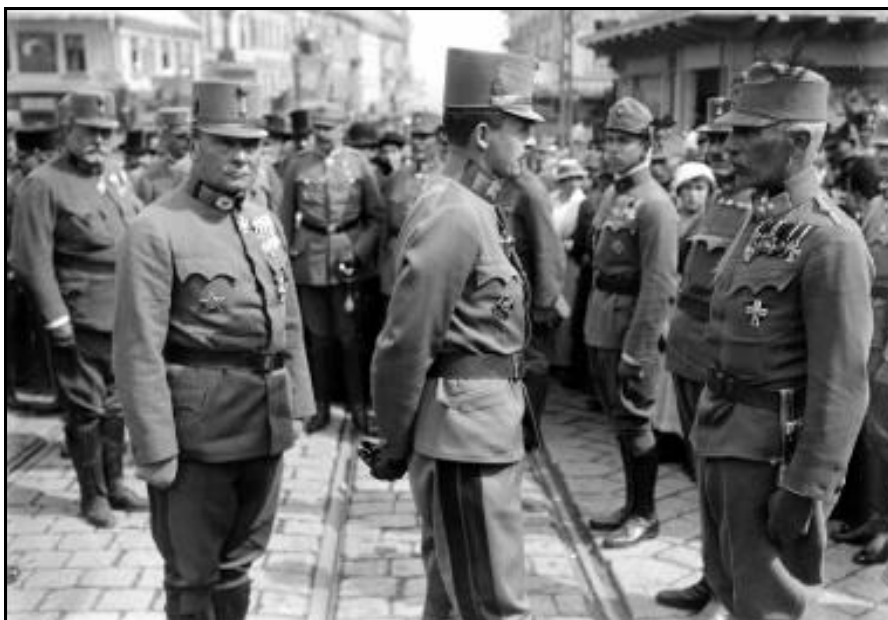
Cernăuți, 1917. Împăratul Carol în piața centrală din Cernăuți vorbind cu generalul Eduard Fischer.