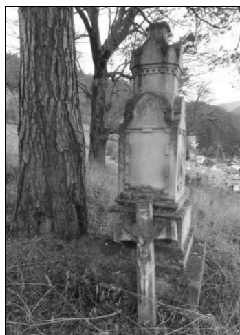
Mormântul lui Bruno Walter din cimitirul catolic din Iacobeni.