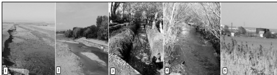
Foto. 2. Rădăuți – hidro-peisaje: 1) Valea Pozenului, în nordul orașului; 2) Valea și lunca Suceviței, în sudul orașului; 3) Toplița, în Parcul central; 4) Valea Temnicului, în nord-estul Rădăuțiului; 5) Iazul Buliga.

Apele care drenează teritoriul orașului sunt: râul Sucevița, care curge la sud de Rădăuți; afluentul acestuia, Toplița, care traversează intravilanul orașului pe direcția V-E; Pozenul, care trece prin nordul zonei administrative și se varsă în Suceava, la Măneuți, printr-un canal de deșurare. În prezent, fostele brațe ale râului Pozen, respectiv Temnic (numit de localnici și Pozen sau Pozănel) și Saha drenează suprafețele de bazin modificate, situate în aval de canalul de deșurare de la Măneuți.