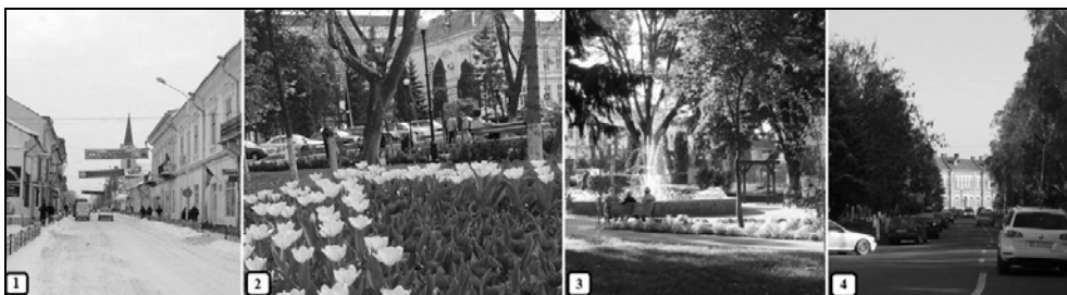
Foto. 3. Rădăuți – peisaje impuse de alternanța anotimpurilor: 1) Peisaj de iarnă pe Str. Ștefan cel Mare; 2, 3) Peisaj de primăvară și de vară în Parcul Primăriei; 4) Peisaj de toamnă pe Calea Bucovinei.

Clima, prin elementele sale, contribuie hotărâtor la modelarea și crearea de peisaje. Implicațiile climatice asupra mediului și peisajului urban sunt numeroase și variate: clima condiționează formarea de topoclimate la nivelul teritoriului, impune specificul învelișului vegetal și de soluri, vegetația fiind un element reper al peisajului; de asemenea, prin succesiunea anotimpurilor, generează diferențieri cu implicații evidente în definirea peisajelor și asupra activității umane.