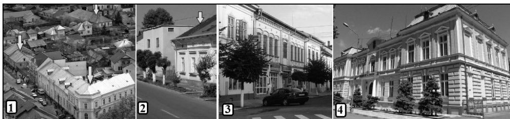
Foto. 4. Rădăuți – clădiri cu specific austriac: 1) Casa Germană; 2) Case pe Calea Cernăuți; 3) Clădiri din centrul istoric; 4) Clădirea Primăriei.

Clima, deși mai rece și mai umedă decât în alte regiuni de podiș din țară, nu a constituit un impediment în valorificarea potențialului natural de către populație. Omul s-a adaptat foarte bine condițiilor de viață de pe teritoriul așezării. Cel mai bine reflectă acest lucru acoperișul caselor, care, pentru a proteja locuința împotriva intemperiilor și a vânturilor, a fost construit în patru ape. Dintre acestea, două sunt late, de formă trapezoidală – și anume, cea din față și cea din spate, care se îmbină la coamă –, iar celelalte două, de la pereții laterali, sunt mai înguste, triunghiulare. Casele cu acoperișul în două ape sunt o inovație alogenă, introdusă pe vremea stăpânirii austriece.