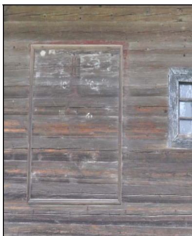
Sf. Cruce din zona pronaosului, perete sudic.