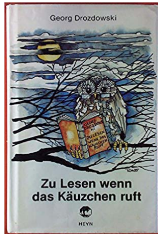
Coperta volumului de povestiri Zu lesen wenn Das Käuzchen ruft. Erzählungen , Klagenfurt, Editura Heyn, 1985.