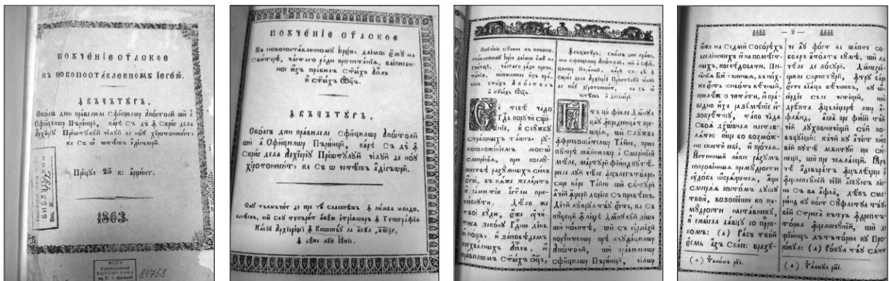
Figura 2. Pagini din cartea ПОУЧЕНИЕ АПОСТОЛЬСКОЕ... (ÎNVĂȚĂTURĂ scoasă din pravilele Sfinților Apostoli și a Sfinților Părinți...), Chișinău, 1863.

Textul este plasat pe două coloane despărțite de o linie – în stânga în rusă (originalul), în dreapta în română (traducerea) cu caractere chirilice. Toate fragmentele coincid pe parcursul întregii cărți, astfel că se poate urmări cu ușurință cum s-a tradus un cuvânt sau altul, ce fel de echivalente s-au găsit, cum au fost redat anumite structuri etc.