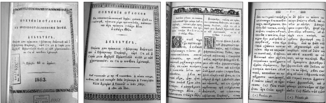
Figura 2. Pagini din cartea ПОУЧЕНИЕ АПОСТОЛЬСКОЕ... (ÎNVĂȚĂTURĂ scoasă din pravilele Sfinților Apostoli și a Sfinților Părinți...), Chișinău, 1863.

Textul este plasat pe două coloane despărțite de o linie – în stânga în rusă (originalul), în dreapta în română (traducerea) cu caractere chirilice. Toate fragmentele coincid pe parcursul întregii cărți, astfel că se poate urmări cu ușurință cum s-a tradus un cuvânt sau altul, ce fel de echivalente s-au găsit, cum au fost redat anumite structuri etc.