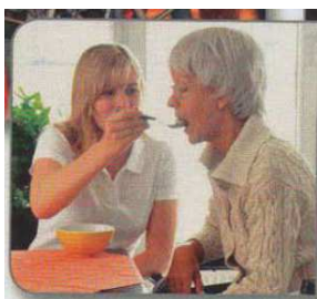
Abb. 7 NW A1 KB, S. 127

Es werden im Lehrwerk hauptsächlich gesunde, vitale, größtenteils schlanke Personen dargestellt und so gut wie keine Personen mit Behinderungen/Beeinträchtigungen gezeigt. Dies entspricht natürlich nicht der lebensweltlichen Realität – Menschen mit Behinderungen/ Beeinträchtigungen werden deshalb im Lehrwerk unsichtbar gemacht. Einzig in Kapitel 11 (Gesund und munter) wird eine alte Dame abgebildet, die auf die Hilfe einer Pflegerin angewiesen ist und möglicherweise im Rollstuhl sitzt (vgl. NW A1 KB 2018, 127). Im Arbeitsbuch werden im selben Kapitel Menschen illustriert, die zu dick sind und denen die Lernenden Tipps im Imperativ geben sollen (vgl. NW A1 AB 2018, 141).