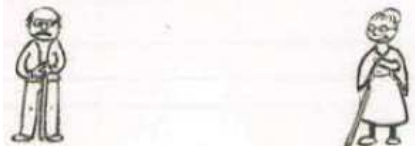
Abb. 3, NW A1 AB 2018, S. 60

Im Lehrwerk werden hauptsächlich junge Menschen bzw. Menschen mittleren Alters dargestellt, alte Menschen bilden die Ausnahme (vgl. NW A1 KB 2018, 127; NW A1 AB 2018, 70, 118 + 147). So findet man beispielsweise nicht einmal in Kapitel 5 (Tag für Tag), wenn es um Familienmitglieder geht, ein Foto der Großeltern. Großeltern werden lediglich im Familienstammbaum im Arbeitsbuch stereotypenhaft als alte Menschen mit Stock dargestellt: