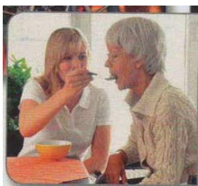
Abb. 7 NW A1 KB, S. 127

Es werden im Lehrwerk hauptsächlich gesunde, vitale, größtenteils schlanke Personen dargestellt und so gut wie keine Personen mit Behinderungen/Beeinträchtigungen gezeigt. Dies entspricht natürlich nicht der lebensweltlichen Realität – Menschen mit Behinderungen/ Beeinträchtigungen werden deshalb im Lehrwerk unsichtbar gemacht. Einzig in Kapitel 11 (Gesund und munter) wird eine alte Dame abgebildet, die auf die Hilfe einer Pflegerin angewiesen ist und möglicherweise im Rollstuhl sitzt (vgl. NW A1 KB 2018, 127). Im Arbeitsbuch werden im selben Kapitel Menschen illustriert, die zu dick sind und denen die Lernenden Tipps im Imperativ geben sollen (vgl. NW A1 AB 2018, 141).