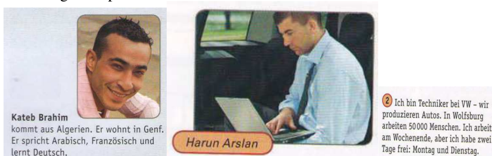
Abb. 4 NW KB A1 2018, S. 12 Abb. 5+6 NW KB A1 2018, S. 20

Auf den Fotos und in den Illustrationen werden überwiegend Menschen weißer Hautfarbe abgebildet, die zum Großteil aus den deutschsprachigen Ländern (dabei hauptsächlich aus Deutschland) bzw. aus Europa stammen. Die Ausnahme bilden Menschen asiatischer Herkunft, eine Person aus den USA und eine Person aus Algerien (vgl. NW KB A1 2018, S. 12). Auch unter den bekannten Persönlichkeiten aus D/A/CH werden ausschließlich Personen weißer Hautfarbe und ohne Migrationshintergrund angeführt (vgl. NW KB A1 2018, 41). Die lebensweltliche Realität, dass die deutschsprachigen Länder Migrationsgesellschaften sind und Menschen unterschiedlicher Herkunft dort (zum Teil seit Generationen) leben, wird nur marginal repräsentiert. Es gibt nur wenige Beispiele: