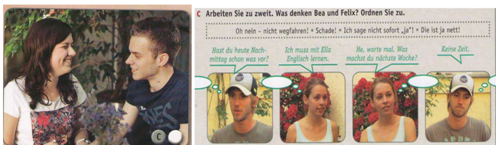
Ben & Carina, Abb. 10 NW A1 KB 2018, S. 52 Bea & Felix, Abb. 11 NW A1 KB 2018, S. 70

Im Zuge der Analyse konnten aber zahlreiche Beispiele gefunden werden, die dem heteronormativen Bild entsprechen. So trifft Ben in Kapitel 5 auf Carina (vgl. NW A1 KB 2018, 52) und im Film in Kapitel 6 knistert es zwischen Bea und Felix (vgl. NW A1 KB 2018, 70). In Kapitel 8 ziehen Carla und Alex zusammen in eine neue Wohnung (vgl. NW A1 KB 2018, 89) und die Paare, die eine Wohnung suchen, entsprechen auch dem heteronormativen Bild (vgl. NW A1 AB 2018, 100). In Kapitel 10 hat Jana ein Date mit einem Mann (vgl. NW A1 KB 2018, 110f), in Kapitel 11 gibt die Frau zu Hause im Wohnzimmer Aufforderungen an ihren kranken Mann (vgl. NW A1 KB 2018, 124).