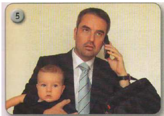
Abb. 1 NW A1 KB 2018, S. 73

das Kind kümmert, aufricht und den Vater an ihre Stelle setzt.