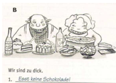
Abb. 8 NW A1 AB, S. 141