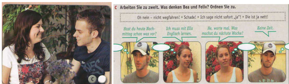
Ben & Carina, Abb. 10 NW A1 KB 2018, S. 52 Bea & Felix, Abb. 11 NW A1 KB 2018, S. 70

Im Zuge der Analyse konnten aber zahlreiche Beispiele gefunden werden, die dem heteronormativen Bild entsprechen. So trifft Ben in Kapitel 5 auf Carina (vgl. NW A1 KB 2018, 52) und im Film in Kapitel 6 knistert es zwischen Bea und Felix (vgl. NW A1 KB 2018, 70). In Kapitel 8 ziehen Carla und Alex zusammen in eine neue Wohnung (vgl. NW A1 KB 2018, 89) und die Paare, die eine Wohnung suchen, entsprechen auch dem heteronormativen Bild (vgl. NW A1 AB 2018, 100). In Kapitel 10 hat Jana ein Date mit einem Mann (vgl. NW A1 KB 2018, 110f), in Kapitel 11 gibt die Frau zu Hause im Wohnzimmer Aufforderungen an ihren kranken Mann (vgl. NW A1 KB 2018, 124).