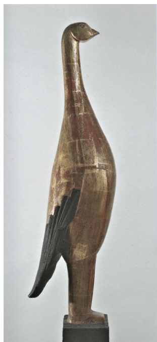
Fig. 3 Ossip Zadkine, Pasăre de aur , 1924