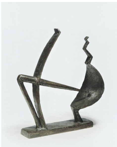
Fig. 7 Alberto Giacometti, Bărbat și femeie , 1928-1929