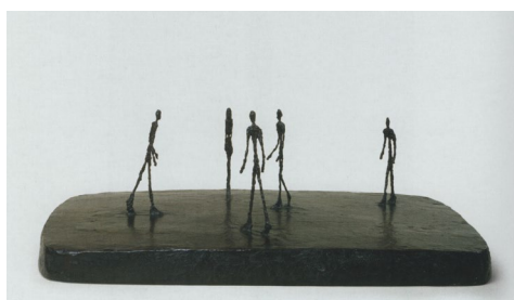
Fig. 11 Alberto Giacometti, Piața , 1948