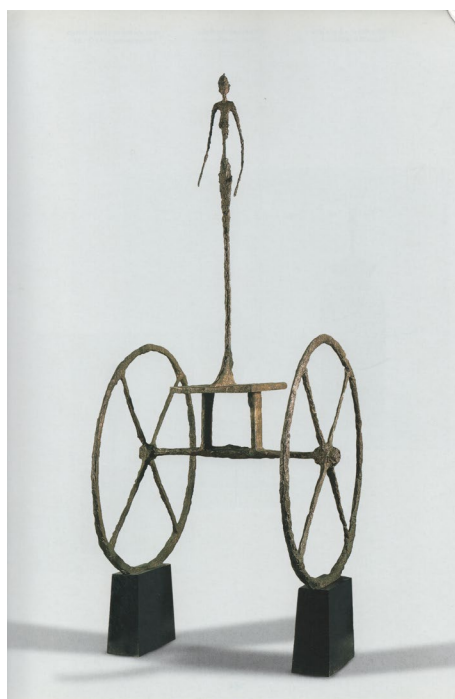
Fig. 12 Alberto Giacometti, Car , 1950