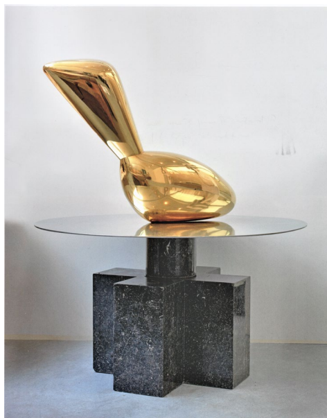
Fig. 14 Constantin Brâncuși, Leda , 1926