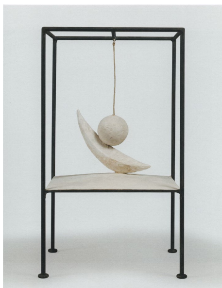
Fig. 8 Alberto Giacometti, Bilă suspendată , 1930-1931