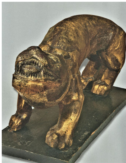
Fig. 2 Ossip Zadkine, Fiară sau Tigru , 1920-1921