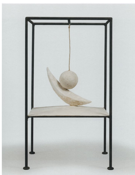
Fig. 8 Alberto Giacometti, Bilă suspendată , 1930-1931