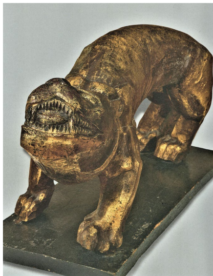
Fig. 2 Ossip Zadkine, Fiară sau Tigr , 1920-1921