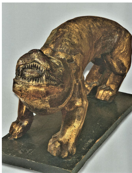
Fig. 2 Ossip Zadkine, Fiară sau Tigru , 1920-1921