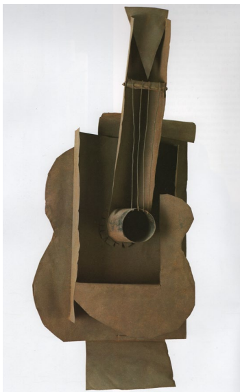
Fig. 1 Pablo Picasso, Chitară , 1912