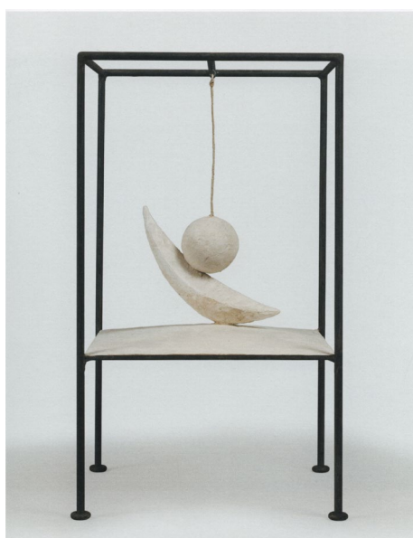
Fig. 8 Alberto Giacometti, Bilă suspendată , 1930-1931