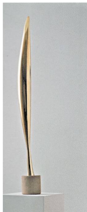
Fig. 4 Constantin Brâncuși, Pasăre în spațiu , 1928