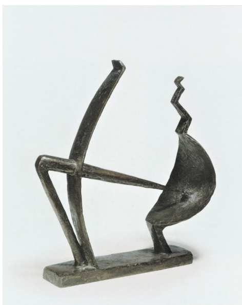
Fig. 7 Alberto Giacometti, Bărbat și femeie , 1928-1929