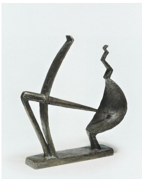
Fig. 7 Alberto Giacometti, Bărbat și femeie , 1928-1929