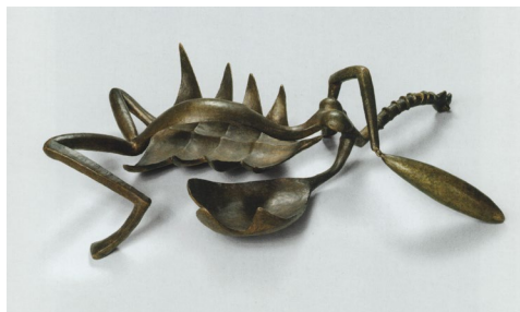
Fig. 10 Alberto Giacometti, Femeie cu gâtul tăiat , 1932