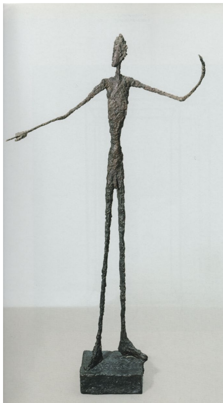
Fig. 13 Alberto Giacometti, Bărbat indicând ceva , 1947