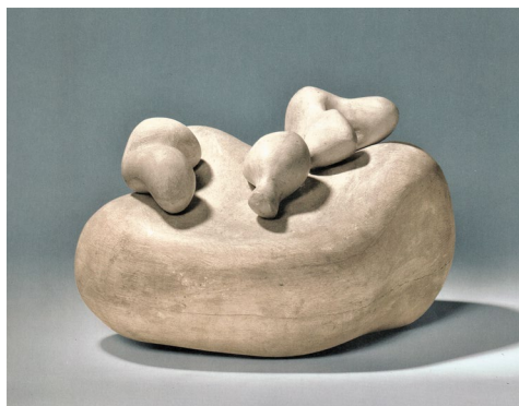
Fig. 6 Jean Arp, Trei obiecte dezagreabile pe o figură , 1930