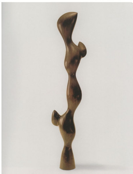
Fig. 5 Jean Arp, Tors cu muguri , 1961