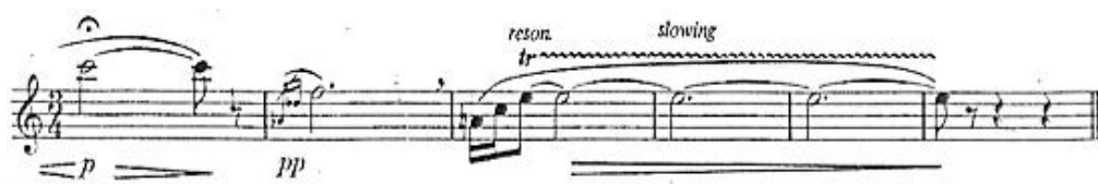
Exemplul nr. 9, finalul lucrării

Lucrarea se încheie cu un tril de rezonanță pe nota Mi în registru mediu cu o durată de aproximativ 9 timpi într-un descrescendo.