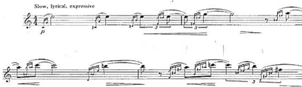
Exemplul nr. 8, introducerea

Din punct de vedere dinamic această lucrare este într-o nuanță foarte mică ajungând la cea mai puternică nuanță pe durata întregii părți la mf , acesta fiind și punctul culminant pe nota Re. Această parte este construită din valori de note mari care sunt ca niște piloni precedați de apogiaturi.