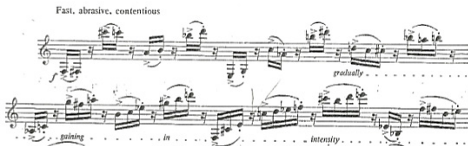
Exemplul nr. 6, secțiunea A

Partea a III-a este creată din două secțiuni: A și B, neavând indicație metrică, măsurile fiind delimitate doar prin pauzele de respirație și cele de caracter. Prima secțiune A începe cu o indicație foarte rapidă care accelerează pe parcurs din măsură în măsură urcând în intensitate. Secțiunea A este formată din grupuri de șaisprezecimi cu accent care sunt despărțite printr-o pauză de șaisprezecime, astfel salturile de șaisprezecime dau impresia de două voci ale clarinetului.