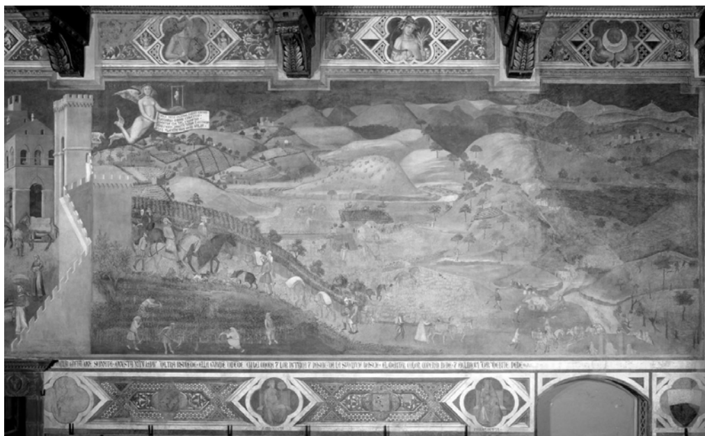
Fig. 5. Efectele Bunei Guvernări la țară (fresca de est, a doua jumătate).