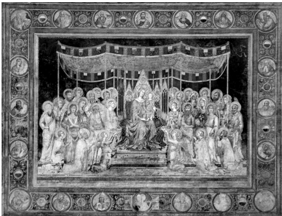
Fig. 7. Maestà (1315/1321), de Simone Martini. Sala Mapamondului, Palatul Public, Siena.