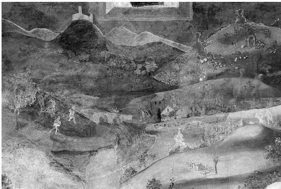
Fig. 6. Efectele Guvernării Binelui personal (Tirania). Teritoriul războiului (detaliu, fesca de vest).