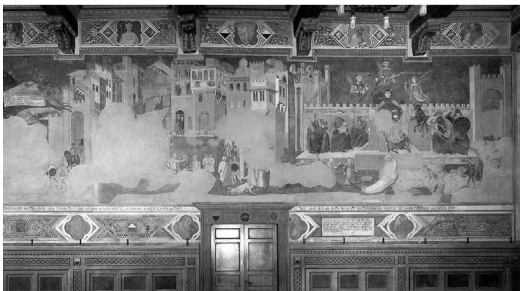
Fig. 6. Efectele Guvernării Binelui personal (Tirania). Orașul războiului (detaliu, fresca de vest).