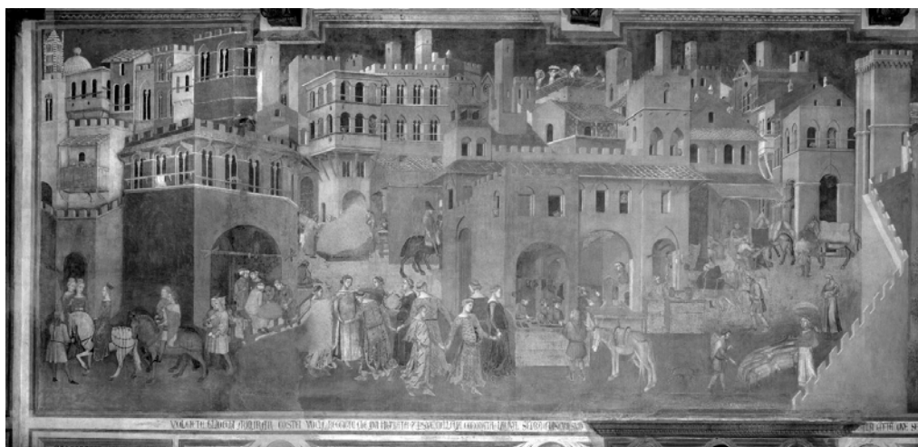
Fig. 4. Efectele Bunei Guvernări în oraş (fresca de est, prima jumătate).