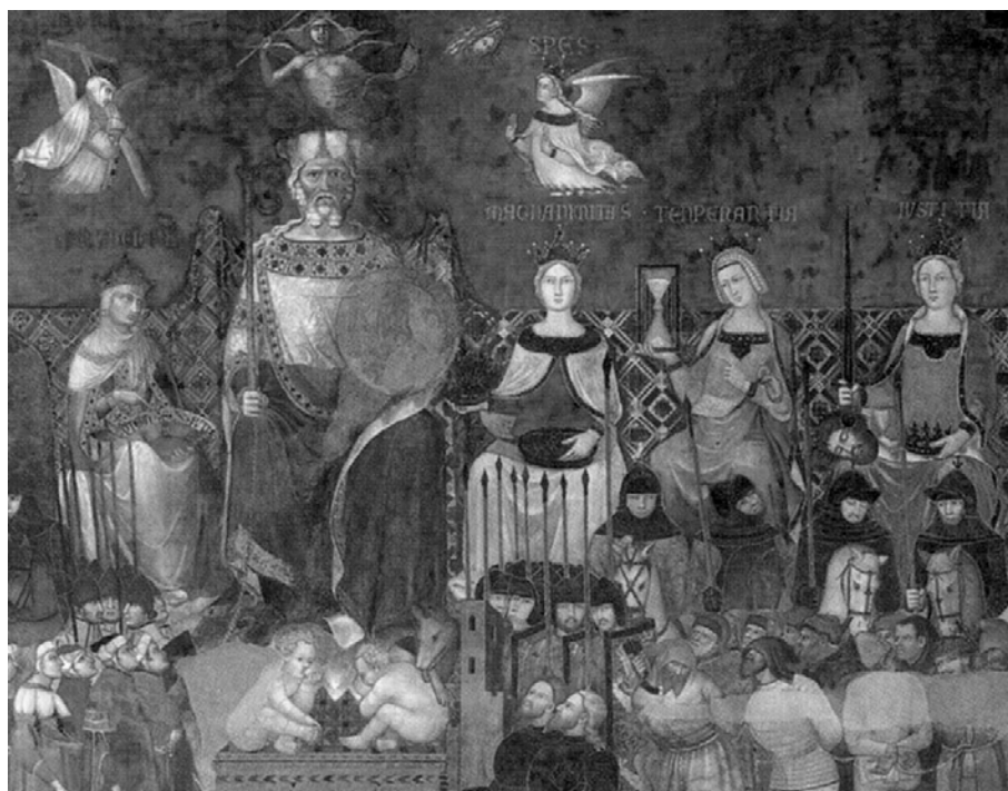
Fig. 2. Binele Comun (Comuna din Siena), virtuțile teologale, virtuți civile, reprezentanți ai corp politic, militar și ai corpului social (detaliu, fresca de nord).