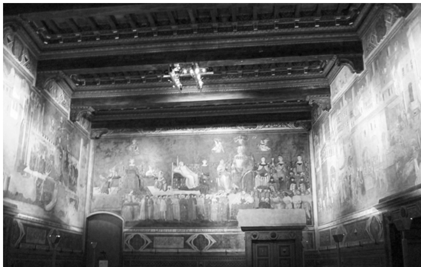
Fig. 1. Alegoria și efectele guvernării Binului comun și ale guvernării Binului Personal (Tirania) (1338-1339), de Ambrogio Lorenzetti. Sala Păcii, Palatul Public, Siena