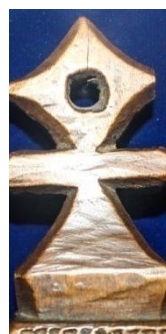
Foto 8: Romb stilizat pe pecetar antropomorf, Colecția Muzeului de Etnografie din Sighetu Marmăției, Maramureșul Voievodal, 2019.