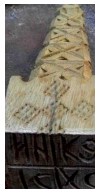
Foto 10: Cruce creștină formată din romburi pe pecetar, Autor: Moș Pupăză/Petru Godja, Valea Stejarului, Maramureșul Voievodal, 79 de ani în anul 2014.