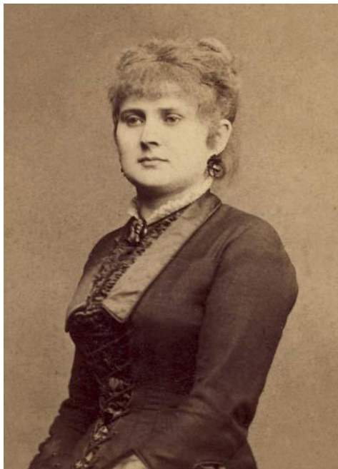
Ultima fotografie a Veronicăi

toare pentru istoria literaturii române. Această oportunitate este oferită drept un regal bibliofil de către prestigioasa editură ieșeană Polirom, care avea s-o dea la iveală în anul 2000, prin apariția revelatoare a volumului epistolar Dulcea mea Doamnă/Eminul meu iubit. Corespondența inedită Mihai Eminescu – Veronica Micle , considerat pe bună dreptate un adevărat eveniment literar al anului respectiv, în care se împlinea un veac și jumătate de la nașterea amândurora. Cuprinzând fragmente sau reproduceri integrale ale scrisorilor celor