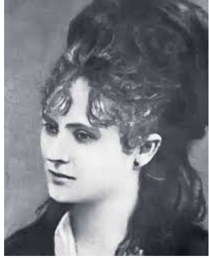
Veronica Micle la 16 ani

Și cuvintele de răspuns ale Veronicăi nu se dezmințeau în dorul ei abia stăpânit: „Eminul meu iubit, (...) când vii să te revăd, să te mai pup, să te mai cânăjesc și apoi să te mai mângâi, și să-ți cer iertare frumușel și apoi într-o lungă și dulce sărutare să se uite toate relele. Când? Mițule când ai putea să vii la Iași să fim împreună ce bine ar fi! Dar tu nicicând nu te gândești la așa ceva, vâlmășagul Bucureștilor îți răpește dorul de mine, viața ta e plină și nu simte trebuința prezenței mele, totuși te pup și te răspup și te îmbrățișez doucement et gentilement. Toute a toi Veronica” (19 martie 1880).