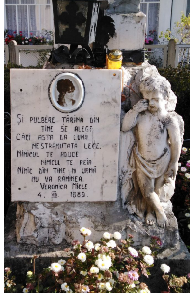
Mormântul Veronicăi Micle de la Mănăstirea Văratec

blicată la 1 aprilie 1873 în „Convorbiri literare”, avea să fie întotdeauna „dulcea” floare a dragostei lor.