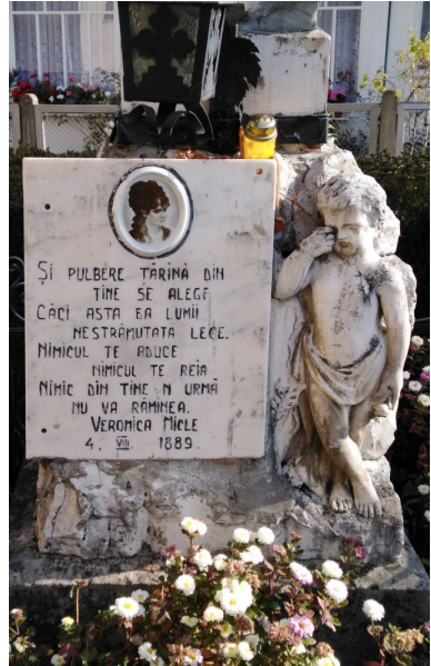
Mormântul Veronicăi Micle de la Mănăstirea Văratec

blicată la 1 aprilie 1873 în „Convorbiri literare”, avea să fie întotdeauna „dulcea” floare a dragostei lor.