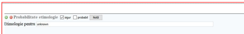
Fig. 4. Secțiunea etimologie pentru sens.

În opinia noastră, redactarea Dicționarului limbii române în format electronic este benefică pentru potențialii utilizatori ai dicționarului, prin caracterul structurat al informației, fiind posibile cercetări variate (semantice, etimologice, stilistice).