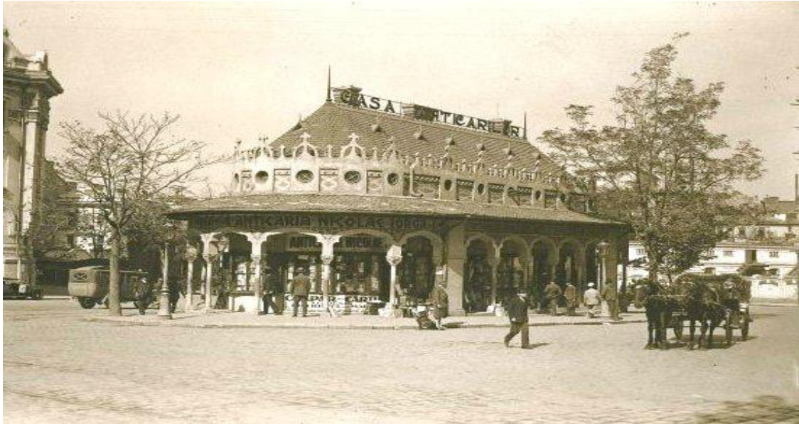
Fig. 1. Casa Anticarilor – vedere frontală 8 .