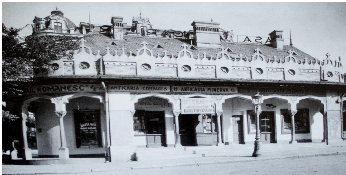
Fig. 2. Casa Anticarilor – vedere laterală 9 .

Toți aceștia și-au păstrat negoțul cu cărți pînă în anul 1948 cînd comerțul a fost preluat de Stat 10 , care doar în decursul aceluși an, a controlat aproximativ 90 de anticariate, printre care Soly Pach de la Casa veche a anticarilor, Azur Mușoiu din Str. Doamnei nr. 1 și Herman Pach de pe Calea Victoriei. (vezi fig. 3).