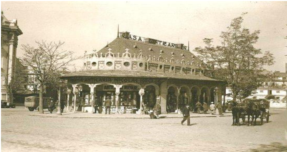
Fig. 1. Casa Anticarilor – vedere frontală 8 .