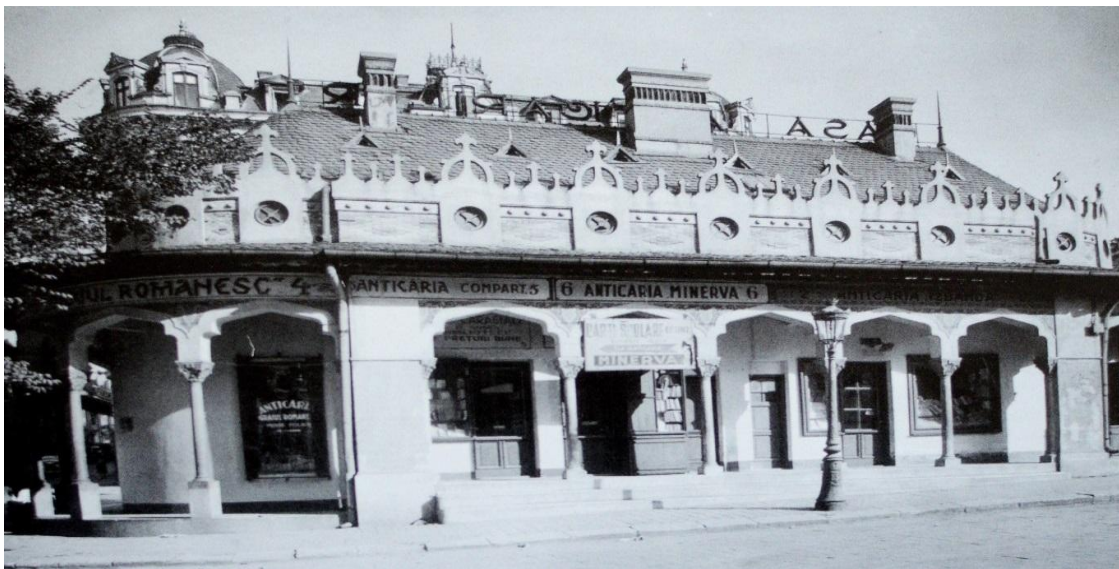
Fig. 2. Casa Anticarilor – vedere laterală 9 .

Toți aceștia și-au păstrat negoțul cu cărți pînă în anul 1948 cînd comerțul a fost preluat de Stat 10 , care doar în decursul aceluși an, a controlat aproximativ 90 de anticariate, printre care Soly Pach de la Casa veche a anticarilor, Azur Mușoiu din Str. Doamnei nr. 1 și Herman Pach de pe Calea Victoriei. (vezi fig. 3).