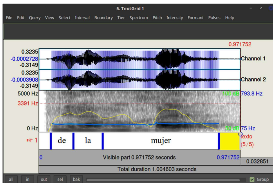
Figura 3. Espectrograma de la muestra perteneciente a la segunda informante (b)

Se observa claramente una diferencia entre la figura 2 y la figura 1: en esta secuencia textual, la voz de la informante 2 presenta una serie sostenida de pulsos, la intensidad es más regular que en el caso de la informante 1, con una media aproximada de 70 dB, y el tono es linear, casi sin interrupciones.