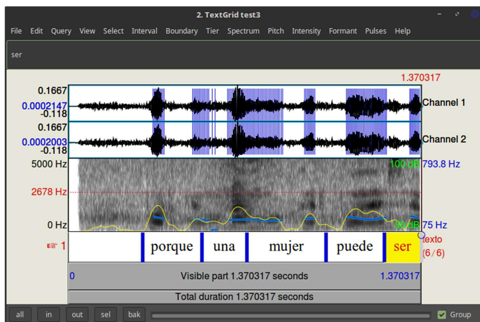
Figura 1. Espectrograma anotado de la muestra perteneciente a la primera informante

Al realizar los espectrogramas, se han añadido también los pulsos, representados por las líneas verticales azules en la parte superior de la barra del sonido. En el caso de la primera informante, los pulsos coinciden con las consonantes. Al igual que los pulsos, la intensidad, representada por la línea curva amarilla de la parte inferior del espectrograma, presenta valores más altos de frecuencia en las consonantes. La línea azul clara situada en la parte inferior del espectrograma representa el tono. El tono de la informante es bajo, la intensidad es bastante baja, dado que el punto máximo llega a 67,64 dB.