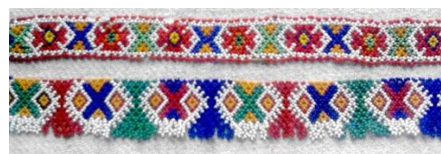
Foto 10: Crucea Sf. Andrei pe podoabe tradiționale, Colecția Muzeului de Etnografie din