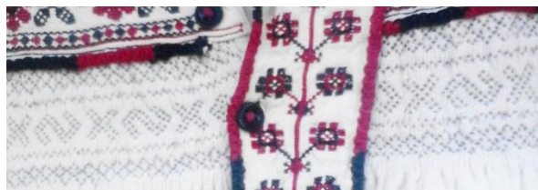
Foto 12: Detaliu. Crucea Sf. Andrei pe un spăcel din Țara Codrului, Colecția Muzeului Județean de Etnografie și Artă Populară din Baia Mare, Maramureș, 2018.