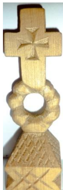
Foto 9a: Cruce creștină pe pecetar, Rogoz, Autor: Șerban Nicolae, Țara Lăpușului, Arhivă personală, 2019.