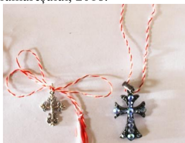
Foto 15a: Cruce creștină aninată de șnurul mărtișorului, Arhivă personală, Maramureș, 2018.