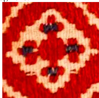
Foto 14: Detaliu. Cruce creștină pe ștergar, Colecția Muzeului Județean de Etnografie și Artă Populară din Baia Mare, Maramureș, 2018.