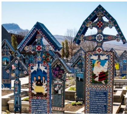
Foto 7: Cruci policrome, Cimitirul Vesel din Săpânța, Țara Maramureșului, Autor: Ioan-Stan Pătraș, 2019.