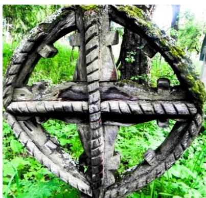
Foto 1: Cruce celtică din lemn, Cimitirul vechi din Breb, Țara Maramureșului, 2018.