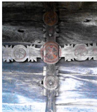
Foto 8: Cruce parcomonială, Biserica „Arhanghelii Mihail și Gavril”, secolul al XVI-lea, Rogoz, Țara Lăpușului, 2019.