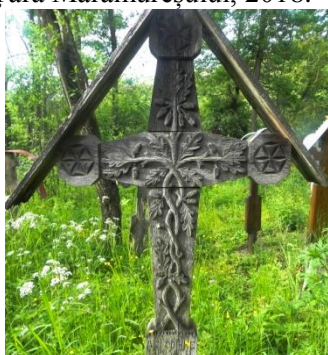
Foto 3: Cruce de lemn cu simbol dendromorf, Cimitirul vechi din Breb, Țara Maramureșului, 2018.