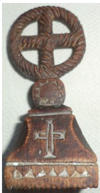
Foto 9c: Cruce celtică și creștină pe pecetar, Colecția Mărie lu' Vodă, Breb, Țara