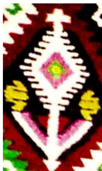
Foto 13: Detaliu. Crucea creștină pe „țol” [covor], Colecția Muzeului de Etnografie, Ieud, Țara Maramureșului, 2018.