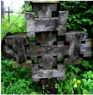
Foto 5: Cruce de lemn cu „pui” [cruciulițe], Cimitirul vechi din Breb, Țara Maramureșului, 2018.