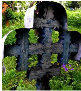
Foto 6: Cruce de lemn cu brațe „vălurite” [ondulate], Cimitirul vechi din Breb, Țara Maramureșului, 2018.