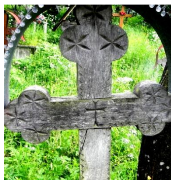
Foto 4: Cruce de lemn cu simbol zoomorf, Cimitirul vechi din Breb, Țara Maramureșului, 2018.