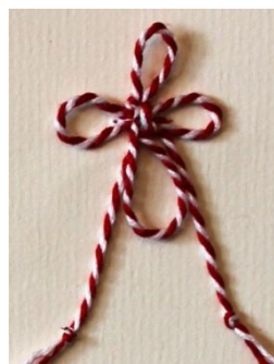
Foto 15b: Șnurul mărtișorului în formă de cruce, Maramureș, 2018.