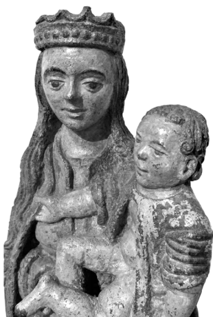
Foto 4. Canonul romanic al sculpturii: imobilism, frontalitate, disproporție anatomică, apud W. Gardner

Viața formelor descătușate sau reglate de canoane reprezintă un subiect inepuizabil de cercetare din perspectiva istoricului de artă. Exemplele furnizate oferă o incursiune în această lume fizică normată diferit a cărei unitate stilistică a fost subliniată prin evidențierea diversității.