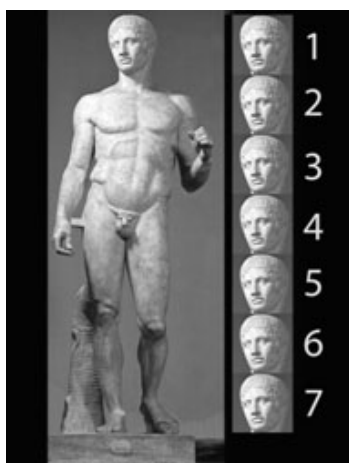
Foto 2. Canonul lui Policlet, sec.V. d.Chr. apud https://www.google/search?=&canon+of+policlet&tbm=isch&cs

În ce privește canoanele stabilite prin observarea naturii de către Policlet (1:7) și discipolul său Lisip (1:7 ½) acestea aveau să stabilească etalonul de reprezentare tridimensională la fel cum în arhitectura ordinelor clasice, secțiunea de aur avea să stabilească raportul de echilibru între parte și întreg (modulul). Artă practică de aceștia, o artă antropocentristă a așezat omul în mediul natural, anatomia umană fiind etalon și pentru arhitectură, prin perfecțiune. Contrapostul dintre principiile formale devine normă de sugestie a mișcării, principiu ce guvernează arta indiferent de stil prin dinamica ce se conturează prin atitudinea de repaus. Acest principiu reapare în faza stilistică a goticului, mișcarea animând compozițiile în plan vertical, dar și relaționarea statuilor de pe fațadele catedralelor cu privitorul, invitat să participe la ascensiunea divină.