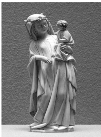
Foto 5. Canonul iconografic gotic: contrapost, naturalism, debutul formelor serpentine, apud W. Gardner .