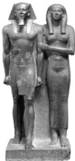
Foto 1. Faraonul Mikerinos și soția, ilustrare a canonului iconografic egiptean: stereotipie, imobilism, lipsă expresivitate, raport 2 X 10 X 6, apud W.Gardner .

Tendința naturalistă în arta occidentală este o continuatoare a celei orientale, aceasta modelând exprimările formale și ilustrând un conținut eclectic de motive și modele. Creațiile naturii sunt cel mai bine imitate în sculptură, prin folosirea rațională a celor trei dimensiuni. Trei dimensiuni stereotipe în arta plastică egipteană, canon iconografic unitar ce se referă la imobilismul figurilor, absența expresivității și pasul către moarte schițat de cei reprezentați.