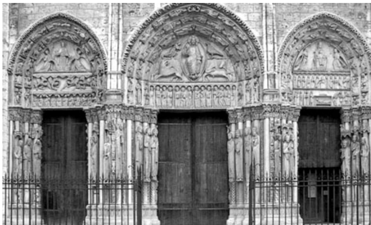
Foto 6. Portalul Regal, fațada catedralei din Chartres, Franța (șantierul școală al sculpturii gotice), apud. W. Gardner.