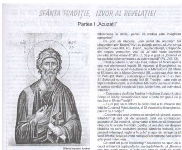
„Sfânta Tradiție, izvor al revelației. Partea întâi Acuzații ”, în Candela , nr. 1-2, ianuarie – februarie 2006.

În imaginea de mai sus observăm din nou, ca și în cazul titlurilor de publicații prezența cu preponderență a substantivelor în titlu. Acest titlul este constituit din trei substantive comune, două în nominativ (tradiție și izvor), unul în genitiv (al revelației) și un adjectiv (sfântă). Prima parte a titlului este izolată prin virgulă de cea de-a doua „izvor al revelației”, care are rol apozitiv, vine ca o explicație și o completare a primei părți.