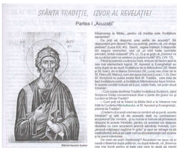
„Sfânta Tradiție, izvor al revelației. Partea întâi Acuzații ”, în Candela , nr. 1-2, ianuarie – februarie 2006.

În imaginea de mai sus observăm din nou, ca și în cazul titlurilor de publicații prezența cu preponderență a substantivelor în titlu. Acest titlul este constituit din trei substantive comune, două în nominativ (tradiție și izvor), unul în genitiv (al revelației) și un adjectiv (sfântă). Prima parte a titlului este izolată prin virgulă de cea de-a doua „izvor al revelației”, care are rol apozitiv, vine ca o explicație și o completare a primei părți.