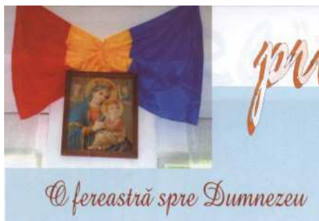
„O fereastră spre Dumnezeu”, în Chemarea Crediței , nr. 153-154, noiembrie – decembrie 2005.

Titlul „O fereastră spre Dumnezeu” este un grup nominal constituit din două substantive „o fereastră” substantiv comun în nominativ, articulat cu articolul nehotărât euclitic „o”, „spre Dumnezeu” – substantiv propriu în acuzativ. Imaginea fotografică anexată titlului arată o icoană cu Maica Domnului și Pruncul, străjuită de un tricolor și poziționată în dreptul unei ferestre, într-o sală de clasă.