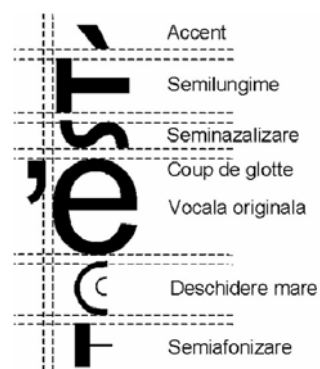
Figura 3. Sintetizarea imaginii unui simbol pornind de la imaginile componentelor sale.

Modul de sintetizare al imaginii unei vocale accentuate căreia îi sunt aplicate 5 fenomene fonetice este schematizat în figura 3. Imaginile simbolurilor asociate vocalei, accentului și fenomenelor sunt generate de sistem într-un mod transparent pentru utilizator și apoi concatenate pentru a forma simbolul final ce va fi afișat. Pentru reprezentarea internă este utilizată codificarea Unicode a caracterelor în cele două corpuri de literă puse la dispoziție: ALR_Baza care este derivat din fontul Arial și ALR_MinionPro care este derivat din fontul Minion Pro. A fost proiectat de asemenea și un font ALR_Simbol ce permite plasarea pe hărțile lingvistice a unor simboluri grafice pentru evidențierea unor trăsături fonetice specifice punctelor de anchetă.