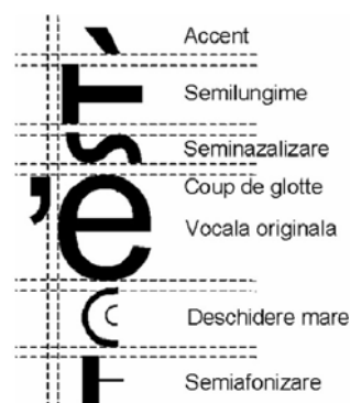
Figura 3. Sintetizarea imaginii unui simbol pornind de la imaginile componentelor sale.

Modul de sintetizare al imaginii unei vocale accentuate căreia îi sunt aplicate 5 fenomene fonetice este schematizat în figura 3. Imaginile simbolurilor asociate vocalei, accentului și fenomenelor sunt generate de sistem într-un mod transparent pentru utilizator și apoi concatenate pentru a forma simbolul final ce va fi afișat. Pentru reprezentarea internă este utilizată codificarea Unicode a caracterelor în cele două corpuri de literă puse la dispoziție: ALR_Baza care este derivat din fontul Arial și ALR_MinionPro care este derivat din fontul Minion Pro. A fost proiectat de asemenea și un font ALR_Simbol ce permite plasarea pe hărțile lingvistice a unor simboluri grafice pentru evidențierea unor trăsături fonetice specifice punctelor de anchetă.