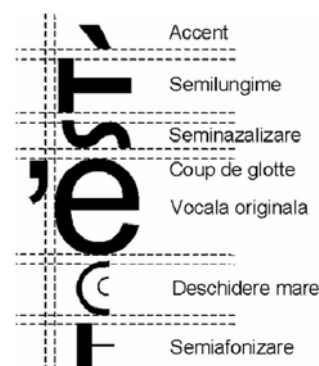
Figura 3. Sintetizarea imaginii unui simbol pornind de la imaginile componentelor sale (Sursa: Bejinariu, 2009).

Modul de sintetizare al imaginii unei vocale accentuate căreia îi sunt aplicate 5 fenomene fonetice este schematizat în figura 3. Imaginile simbolurilor asociate vocalei, accentului și fenomenelor sunt generate de sistem într-un mod transparent pentru utilizator și apoi concatenate pentru a forma simbolul final ce va fi afișat. Pentru reprezentarea internă este utilizată codificarea Unicode a caracterelor în cele două corpuri de literă puse la dispoziție: ALR_Baza care este derivat din fontul Arial și ALR_MinionPro care este derivat din fontul Minion Pro. A fost proiectat de asemenea și un font ALR_Simbol ce permite plasarea pe hărțile lingvistice a unor simboluri grafice pentru evidențierea unor trăsături fonetice specifice punctelor de anchetă.