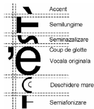
Figura 3. Sintetizarea imaginii unui simbol pornind de la imaginile componentelor sale.

Modul de sintetizare al imaginii unei vocale accentuate căreia îi sunt aplicate 5 fenomene fonetice este schematizat în figura 3. Imaginile simbolurilor asociate vocalei, accentului și fenomenelor sunt generate de sistem într-un mod transparent pentru utilizator și apoi concatenate pentru a forma simbolul final ce va fi afișat. Pentru reprezentarea internă este utilizată codificarea Unicode a caracterelor în cele două corpuri de literă puse la dispoziție: ALR_Baza care este derivat din fontul Arial și ALR_MinionPro care este derivat din fontul Minion Pro. A fost proiectat de asemenea și un font ALR_Simbol ce permite plasarea pe hărțile lingvistice a unor simboluri grafice pentru evidențierea unor trăsături fonetice specifice punctelor de anchetă.