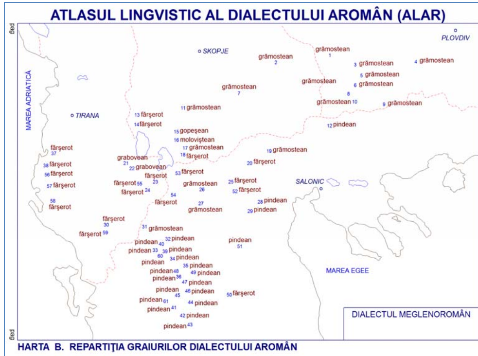
Figura 6. Harta cu repartiția graiurilor dialectului aromân; sursa: generată automat folosind aplicația AlrMaps.

Aromânii, în număr de peste 500 000 în țările balcanice, sunt urmașii populației autohtone romanizate, la fel ca românii nord-dunăreni, simbolizând „efigia Romei” între vorbitorii altor limbi: greci, albanezi, bulgari, macedoneni (slavi). Este un miracol păstrarea vie, până în zilele noastre, în rândul aromânilor, a conștiinței romane, a apartenenței lor la poporul român. Atlasul lingvistic al dialectului aromân (ALAR) evidențiază cu pregnanță romanitatea aromânilor.