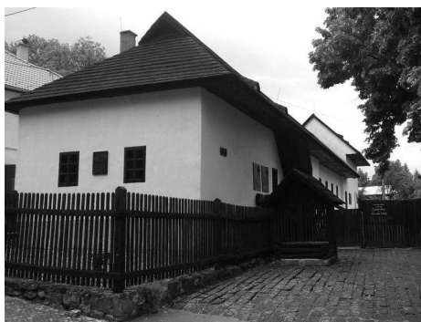
Obr. 1 Rodný dom 3

Ľ. Štúr sa tu narodil preto, lebo jeho otec bol učiteľ a v dnešnom múzeu mala sídlo nielen škola, ale bol tu aj učiteľský byt. Narodenie A. Dubčeka v rovnakej budove bolo veľkou náhodou. Jeho rodičia sa zoznámili v Amerike, aj sa tam zosobášili. Vrátili sa na Slovensko, do Uhrovca, odkiaľ pochádzala rodina Dubčekovho otca. Nemohli sa hneď nastáňovať do domu, do ktorého chceli, a keďže táto budova patrila evanjelickej cirkvi, poskytli im tam dočasné ubytovanie, kde sa Dubček narodil.