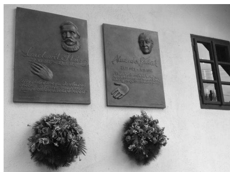
Obr. 2 Pamätná tabuľa 1