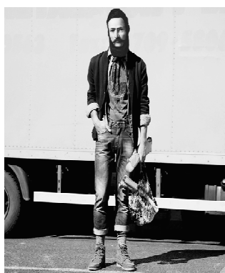
Obr. 9 Súčasný portrét Ľ. Štúra 3