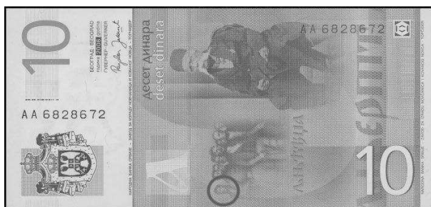
Obr. 6 Srbská bankovka v nominálnej hodnote 10 dinárov s vyznačenou podobizňou L. Štúra

Podobizeň L. Štúra sa nachádza(ia) nielen na platidlách našej krajiny, ale prekvapivo ju nájdeme aj na aktuálnej srbskej bankovke v nominálnej hodnote 10 dinárov. Fotografia zachytáva Slovanský zjazd v Prahe z roku 1848, na ktorom sa stretli poprední slovanskí predstavitelia s cieľom zjednotiť všetkých Slovanov žijúcich v rakúskej monarchii. L. Štúr je na fotografii na kraji úplne vľavo.