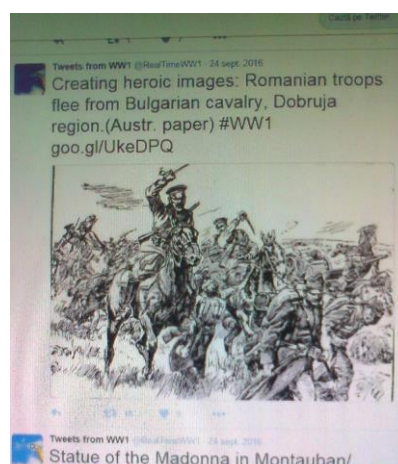
Fig. 1. Lupte între trupele românești și cavaleria bulgară în Dobrogea

Jurnalele, scrisorile, fotografiile, desenele sau poeziile personale sunt folosite pentru descrierea vieții de zi cu zi a oamenilor, indiferent de care parte a baricadei au luptat guvernele lor în timpul războiului.