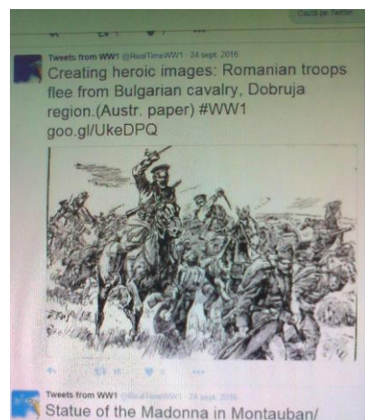
Fig. 1. Lupte între trupele românești și cavaleria bulgară în Dobrogea

Jurnalele, scrisorile, fotografiile, desenele sau poeziile personale sunt folosite pentru descrierea vieții de zi cu zi a oamenilor, indiferent de care parte a baricadei au luptat guvernele lor în timpul războiului.