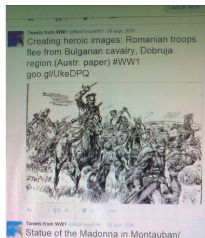
Fig. 1. Lupte între trupele românești și cavaleria bulgară în Dobrogea

Jurnalele, scrisorile, fotografiile, desenele sau poeziile personale sunt folosite pentru descrierea vieții de zi cu zi a oamenilor, indiferent de care parte a baricadei au luptat guvernele lor în timpul războiului.