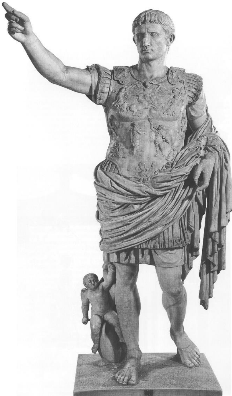
Fig. 7. Augustus (27 î.Ch-14 d.Ch.). Muzeul Vatican, Roma.