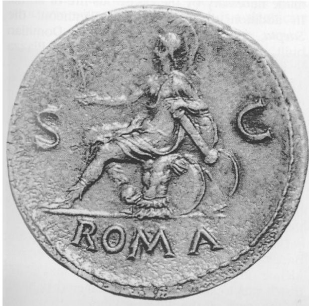
Fig. 8. Alegoria Romei. Monedă (verso) din timpul domniei lui Nero (54-68 d.Ch.). Monetăria Romei.