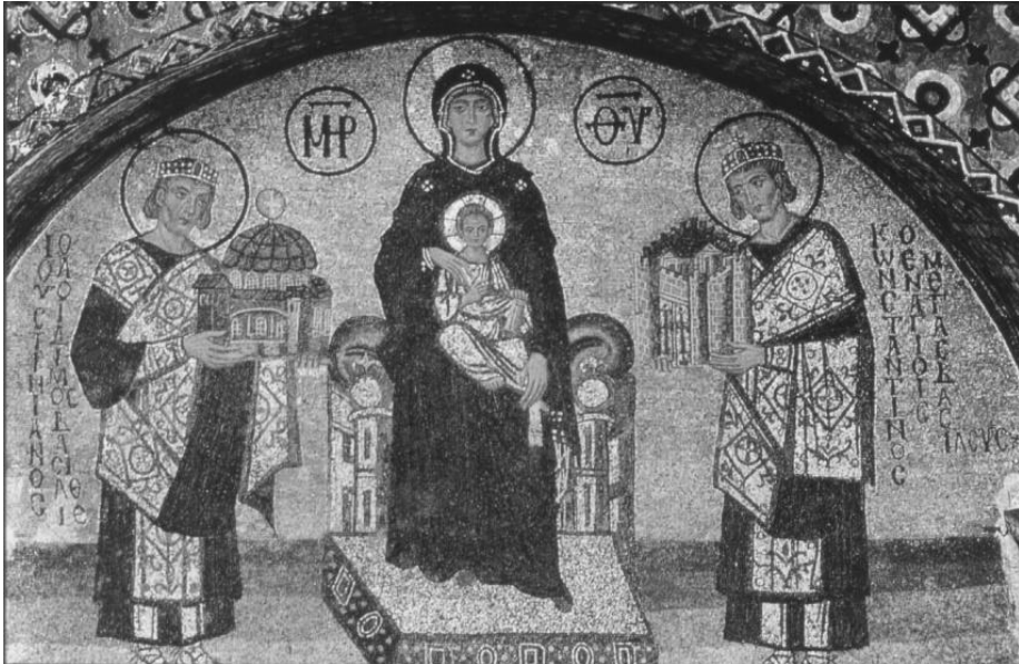
Fig. 10. Iustinian I (stânga) și Constantin I (dreapta), închinând Fecioarei cu pruncul, primul, Hagia Sophia, și al doilea, cetatea Constantinopolului. Mozaic, 990. Galeria de Sud. Hagia Sophia, Istanbul.