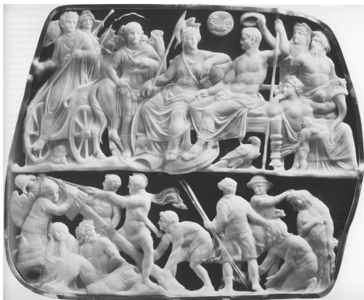
Fig. 3. Gemma Augustea , 10 d.Ch. (18,7 x 22,3 cm). Muzeul de istorie a artei, Viena.