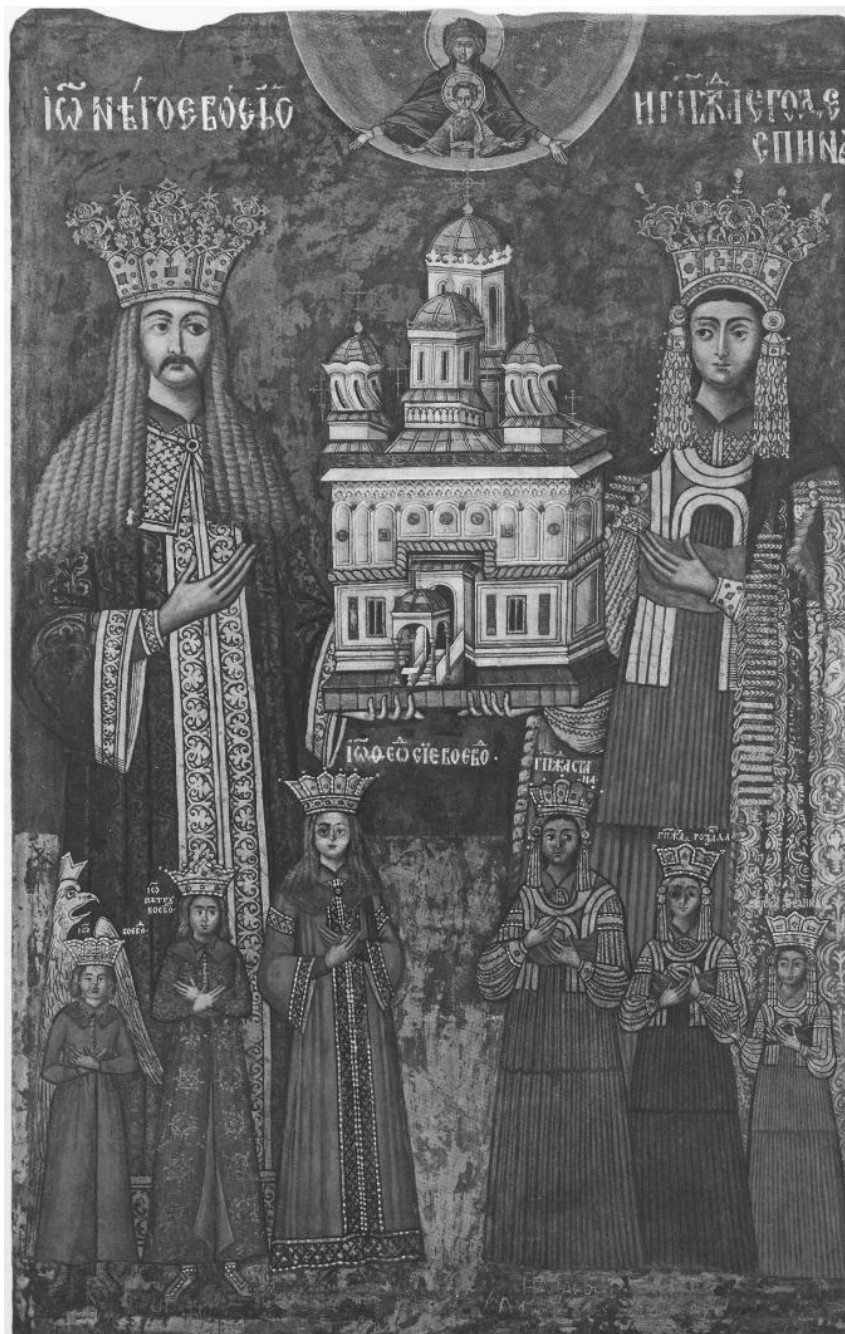
Fig. 12. Tabloul votiv al lui Neagoe Basarab (1512-21), al doamnei Despina Milița (1512-21) și al copiilor lor. Frescă, înainte de 1526. Meșterul Dobromir. Mănăstirea Curtea de Argeș, Argeș.