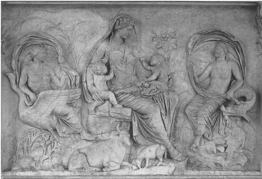
Fig. 9. Ara Pacis Augustae (9 î.Ch.). Figura alegorică a lui Tellus, Pământul (Italia sau Pacea). Ara Pacis, Roma.