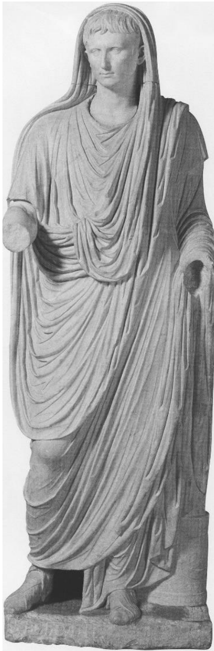
Fig. 6. Augustus, ca Pontifex Maximus (27 î.Ch-14 d.Ch.). Palatul Massimo alle Terme. Muzeul Național Roman, Roma.