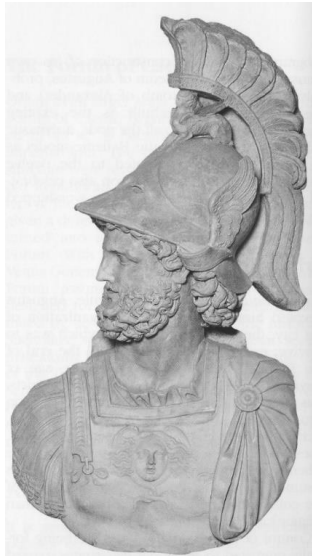
Fig. 5. Mars Ultor , prima parte sec. II d.Ch. (copie). Templul augustean al lui Mars Ultor , Roma.