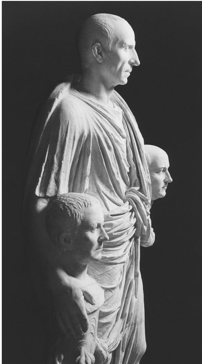
Fig. 1. Togatus Barberini . Nobil cu togă, ținând busturile strămoșilor. A doua parte a sec. I î.Ch. Muzeul Capitolin, Roma.