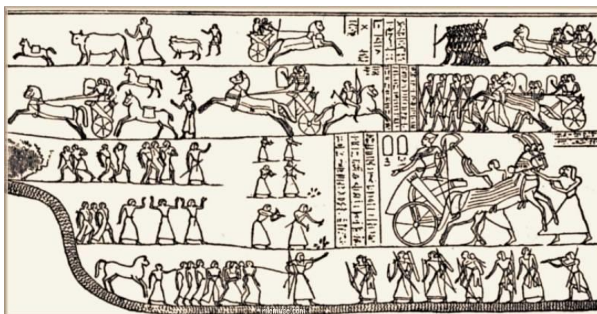
2. Bătălia de la Kadesh (Ramses al II-lea).