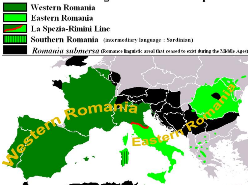
Figura 1: Area linguistica romanza in Europa 6 The Romance Linguistic Area in Europe

Una differenza linguistica si fa a livello dialettale, dove nell'attuale Romania parliamo in gran parte del dialetto dacoromeno, 7 mentre l'Italia offre un panorama linguistico diversificato. Riguardo questo tipo di somiglianze, i teorici osservano che le varianti sud-danubiane (a volte in consenso con le favelle dacoromene dell'ovest e nord) presentano il più grande numero di assomiglianze del sud Italia. 8 Anche M. Bartoli, una delle figure illustri della linguistica italiana, situa il romeno insieme ai dialetti della costa Adriatica. 9 I suoi predecessori, A. Griera (1922), W. Wartburg (1936), J. Herman (1985) avvicinano il romeno ai dialetti italiani centro-meridionali. In questo senso si avvicina anche la nostra ricerca, che propone inizialmente un'analisi tramite il legame comune tra i due territori: il latino nonnus che produce nun rispettivamente nonno .