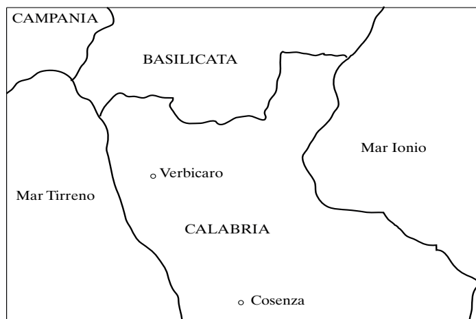
Figura 1. Posizione geografica di Verbicaro

diretto lessicale, infatti (il tipo Gianni ha mangiato la mela ), l'accordo si mantiene (come nei dialetti alto-meridionali più conservativi) solo se il participio presenta flessione interna metafonetica, mentre è agrammaticale se il participio ha flessione esclusivamente affissale (v. il §5.2). Di questa particolarità, che il verbicarese condivide con alcuni altri dialetti parlati entro l'area Lausberg o nelle immediate vicinanze, si offrirà un inquadramento geolinguistico al §7, dopo aver perfezionato al §6 la descrizione delle condizioni verbicaresi con l'analisi delle differenze che il dialetto innovativo oggi presenta rispetto a quello dei più anziani: l'innovazione consiste nel divenire opzionale dell'accordo in tutti i costrutti riflessivi, che invece lo presentano categoricamente nel verbicarese conservativo. Anche questo mutamento in corso, così come la perdita selettiva dell'accordo con l'oggetto diretto lessicale (fronte quest'ultimo sul quale le due varietà verbicaresi non si differenziano), si inquadra entro la generale deriva diacronica romanza che ha visto una progressiva riduzione dell'accordo del participio passato nelle perifrasi verbali perfettive.