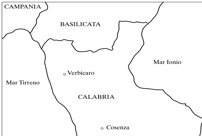
Figura 1. Posizione geografica di Verbicaro

diretto lessicale, infatti (il tipo Gianni ha mangiato la mela ), l'accordo si mantiene (come nei dialetti alto-meridionali più conservativi) solo se il participio presenta flessione interna metafonetica, mentre è agrammaticale se il participio ha flessione esclusivamente affissale (v. il §5.2). Di questa particolarità, che il verbicarese condivide con alcuni altri dialetti parlati entro l'area Lausberg o nelle immediate vicinanze, si offrirà un inquadramento geolinguistico al §7, dopo aver perfezionato al §6 la descrizione delle condizioni verbicaresi con l'analisi delle differenze che il dialetto innovativo oggi presenta rispetto a quello dei più anziani: l'innovazione consiste nel divenire opzionale dell'accordo in tutti i costrutti riflessivi, che invece lo presentano categoricamente nel verbicarese conservativo. Anche questo mutamento in corso, così come la perdita selettiva dell'accordo con l'oggetto diretto lessicale (fronte quest'ultimo sul quale le due varietà verbicaresi non si differenziano), si inquadra entro la generale deriva diacronica romanza che ha visto una progressiva riduzione dell'accordo del participio passato nelle perifrasi verbali perfettive.