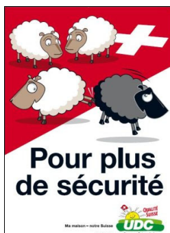
Fig. 2 (année 2007).

La figure suivante est encore plus explicitement acharnée si l'on peut dire en ceci que l'un des moutons blancs sur un fond de drapeau symbolisant le territoire suisse boute dehors le mouton noir « pour plus de sécurité ». Une fois encore le texte et l'image convergent pour mettre en place l'idéologie xénophobe :