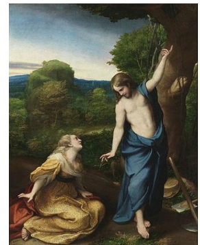
Noli me tangere de Antonio Allegri da Correggio, zis Le Corregge, 1525

construiesc pe baza categorizărilor sociale, larg acceptate. Prejudecățile sunt atitudini sau răspunsuri afective formulate fără analiza corectă sau în profunzime a obiectului ori fără a avea suficientă informație despre acesta. Se bazează pe judecăți stereotipe, pe generalizări incorecte sau pripite și de obicei au încărcătură negativă și sunt amprentate emoțional. În Scrisoarea IV aparența angelică a unei pământene indică prezența stereotipului femeii înger atât de persiflat și de către unii dintre contemporanii lui Eminescu (vezi formularea caragialiană „Angel radios!”). Descrierea femeii angelice este umbrită de congresul de rubedenii, de superficialitatea și frivolitatea femeii, care nu are atributele convenite de stereotip. În acest caz, stereotipul devalorizează imaginea prin contrast, iar autorul parodiază celebrul tablou al lui Correggio Noli me tangere ( Nu mă atinge, Nu mă mai reține, Nu te mai agăța de mine, Încetează să ... ), celebrele cuvinte ale lui Iisus adresate Mariei din Magdala în dimineața Învierii pascale ( Ioan 20: 17):