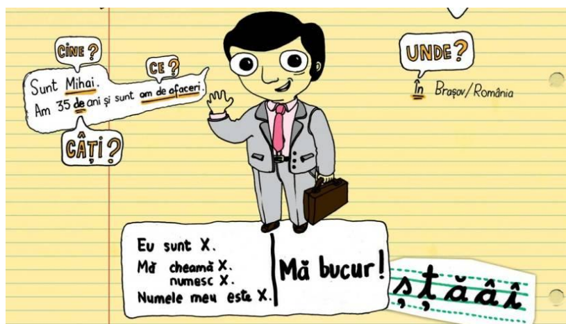
fig. 14: Kohn 2009: 20

Un manual monolingv, tocmai pentru că nu se bazează pe o altă limbă pentru a funcționa, facilitează și pretinde apariția unui nou canal pe care pot fi introduse elemente lingvistice necesare în procesul didactic. Instrucțiunile exercițiilor conțin în manualul elaborat de Platon, Sonea, Vîlcu deja din prima lecție verbe ce sunt traduse grafic cu ajutorul iconurilor ( a citi, a scrie, a vorbi, a asculta etc.). Întâlnind aceste forme la tot pasul, cursantul le reține mult mai ușor și fără a face un efort suplimentar. Acesta este doar unul dintre avantajele manualului monolingv.