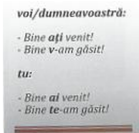
fig. 12: Platon, Sonea, Vîlcu 2012: 16

Introducerea în manualul apărut la Cluj a elementelor de limbă pe o structură de adâncime a unui manual de gramatică pare să domine în primele lecții, dar, totuși, situațiile de comunicare abordate primesc expresiile utile lor, fără a încărca cursantul suplimentar cu reguli gramaticale ce îi depășesc la acest nivel necesitățile și puterea de înțelegere. Întâlnim astfel structuri ca Îmi pare bine. | Bine ai venit. | Bine te-am găsit. | Ce mai faci? | Mă numesc Felix. etc. Cursantul suportă o cantitate redusă de structuri pe care le reține și utilizează ca atare, fără a dori să înțeleagă neapărat și forma lor gramaticală. Aceste formule necesare în situațiile de comunicare tematizate sunt evidențiate grafic, după ce au fost utilizate în dialoguri, prin gruparea lor într-o casetă (vezi fig. 12 și 13).