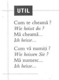
fig. 5: Suciu, Fazacaș 2006: 9

Suciu/ Fazacaș realizează cât de important este pentru cel ce învață o limbă străină ca intervenția lui într-un dialog real să nu fie forțată, ci cât mai naturală, iar pentru asta are nevoie de expresii ce îi depășesc uneori nivelul de înțelegere a formelor gramaticale pe care acestea le conțin (de exemplu: Mă numesc... , Mă cheamă... etc. – Suciu, Fazacaș 2006: 9). Expresiile uzuale apar cu naturalețe în dialogurile didactizate, dar sunt scoase în evidență suplimentar prin gruparea lor în casete grafice: