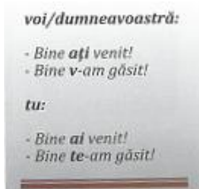
fig. 12: Platon, Sonea, Vîlcu 2012: 16

Introducerea în manualul apărut la Cluj a elementelor de limbă pe o structură de adâncime a unui manual de gramatică pare să domine în primele lecții, dar, totuși, situațiile de comunicare abordate primesc expresiile utile lor, fără a încărca cursantul suplimentar cu reguli gramaticale ce îi depășesc la acest nivel necesitățile și puterea de înțelegere. Întâlnim astfel structuri ca Îmi pare bine. | Bine ai venit. | Bine te-am găsit. | Ce mai faci? | Mă numesc Felix. etc. Cursantul suportă o cantitate redusă de structuri pe care le reține și utilizează ca atare, fără a dori să înțeleagă neapărat și forma lor gramaticală. Aceste formule necesare în situațiile de comunicare tematizate sunt evidențiate grafic, după ce au fost utilizate în dialoguri, prin gruparea lor într-o casetă (vezi fig. 12 și 13).