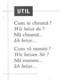
fig. 5: Suciu, Fazakaș 2006: 9

Suciu/ Fazakaș realizează cât de important este pentru cel ce învață o limbă străină ca intervenția lui într-un dialog real să nu fie forțată, ci cât mai naturală, iar pentru asta are nevoie de expresii ce îi depășesc uneori nivelul de înțelegere a formelor gramaticale pe care acestea le conțin (de exemplu: Mă numesc... , Mă cheamă... etc. – Suciu, Fazakaș 2006: 9). Expresiile uzuale apar cu naturalețe în dialogurile didactizate, dar sunt scoase în evidență suplimentar prin gruparea lor în casete grafice: