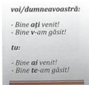
fig. 12: Platon, Sonea, Vîlcu 2012: 16

Introducerea în manualul apărut la Cluj a elementelor de limbă pe o structură de adâncime a unui manual de gramatică pare să domine în primele lecții, dar, totuși, situațiile de comunicare abordate primesc expresiile utile lor, fără a încărca cursantul suplimentar cu reguli gramaticale ce îi depășesc la acest nivel necesitățile și puterea de înțelegere. Întâlnim astfel structuri ca Îmi pare bine. | Bine ai venit. | Bine te-am găsit. | Ce mai faci? | Mă numesc Felix. etc. Cursantul suportă o cantitate redusă de structuri pe care le reține și utilizează ca atare, fără a dori să înțeleagă neapărat și forma lor gramaticală. Aceste formule necesare în situațiile de comunicare tematizate sunt evidențiate grafic, după ce au fost utilizate în dialoguri, prin gruparea lor într-o casetă (vezi fig. 12 și 13).