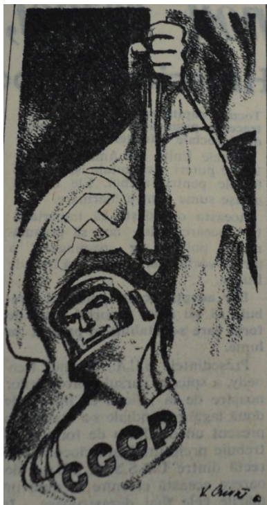
Desen propagandistic înfățișând un cosmonaut ridicând Flamura Victoriei în Cosmos. (Scânteia 7 august 1961)