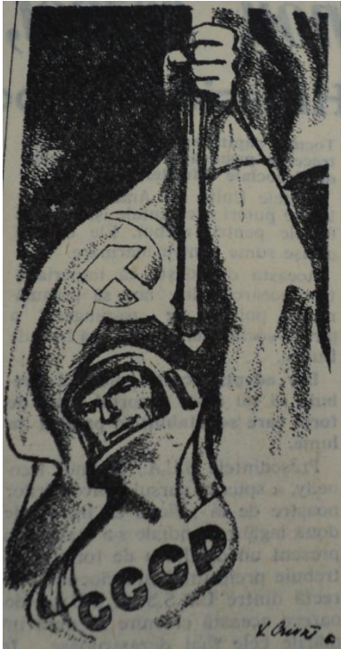
Desen propagandistic înfățișând un cosmonaut ridicând Flamura Victoriei în Cosmos. (Scânteia 7 august 1961)