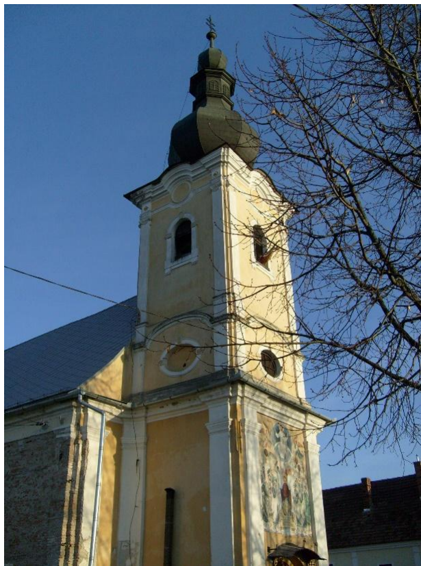
Fig. 5. Biserica de Piatră cu hramul Învierea Domnului