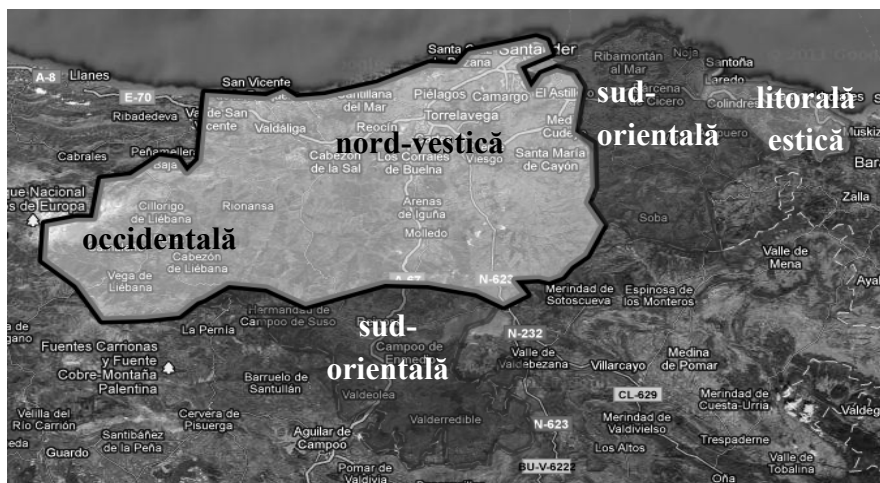
Figura 1. Zonele analizate

În lumina acestor considerente, aceste obiective sunt, fără îndoială, relevante pentru definirea intonației din Cantabria.