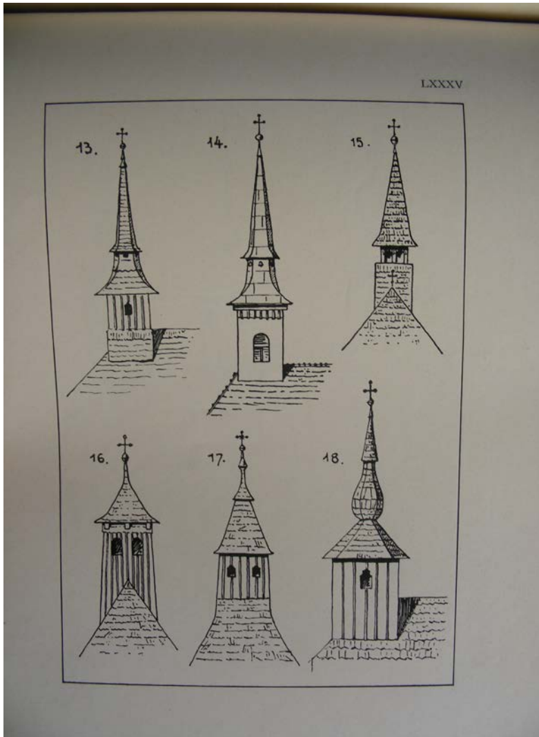
Fig. 3. Tipi di torri-campanili del dipartimento Bihor (Coriolan Petranu, Monumentele istorice... )