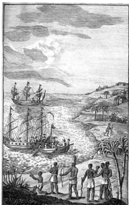
Ажѣнцѣрѣ ашѣ Колѣмѣ на пѣмѣнтѣа Амѣричѣи. Фѣца 42.

Diversificarea tematică a artei ilustrației cărții românești vechi, la care tipografia românească din Buda și-a adus o contribuție de netăgăduit, este dovedită și de cele patru gravuri în metal din Descoperirea Americii . Această carte, prin conținutul și ilustrațiile ei, deschidea apetitul oamenilor vremii spre știință, călătorii, studii geografice și etnografice.