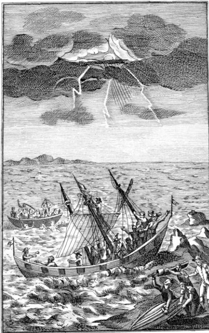
Γρόαζνικκ φερτςνκ πε μάρε. φάχα 67.