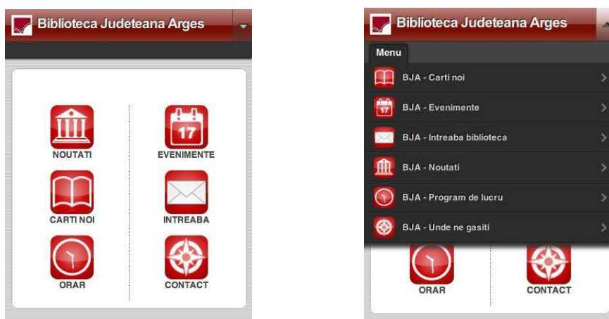
Figura 2. Ecrane de întâmpinare al site-ului www.bjarges.ro Ecran cu afișare tip simbol (stânga) și ecran cu afișare text (dreapta)

Ecranul de întâmpinare este cel din Fig. 2.