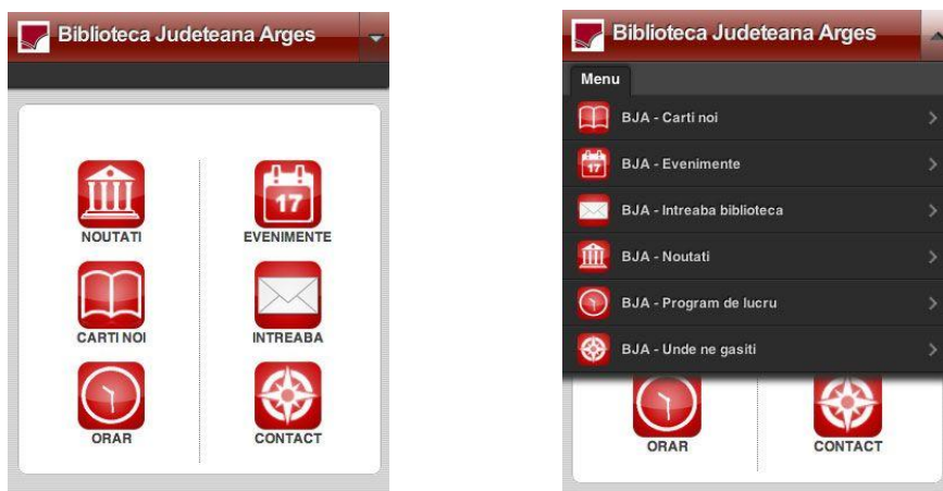
Figura 2. Ecrane de întâmpinare al site-ului www.bjarges.ro Ecran cu afișare tip simbol (stânga) și ecran cu afișare text (dreapta)

Ecranul de întâmpinare este cel din Fig. 2.