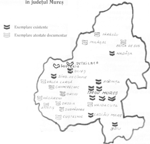
PREZENȚA ȘI CIRCULAȚIA NOULUI TESTAMENT DE LA BĂLGARAD în județul Mureș

Petrilaca. 21 În 1865-1867 exista la parohie, fiind inclusă în lista cărților și periodicelor trimise Mitropoliei de la Blaj.